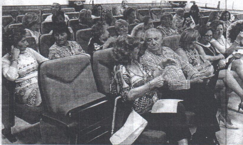
Los alumnos de la Universidad de Mayores, en el aula de grados, antes de iniciarse la clausura del curso.

Ayer se clausuró el curso de la Universidad de Mayores con la entrega de los diplomas a los alumnos y los discursos de los profesores que han participado en esta actividad. Molina aseguró que este cierre de curso es más alegre que el de los otros estudiantes de la UGR, ya que los mayores no tienen que hacer exámenes ni demostrar sus conocimientos.