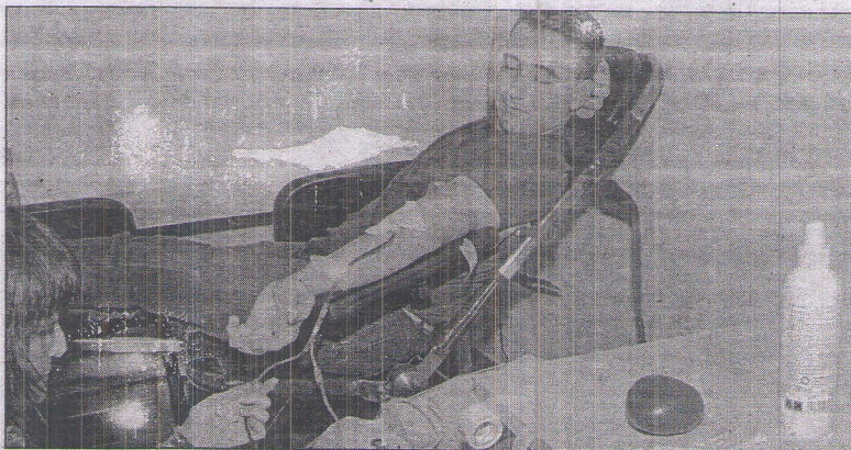
Los estudiantes respondieron al llamamiento del segundo maratón

La actividad, con el apoyo del Ingesa, la Ciudad y la Facultad de Enfermería, se organizó aprovechando la celebración del Día Internacional de la Enfermería