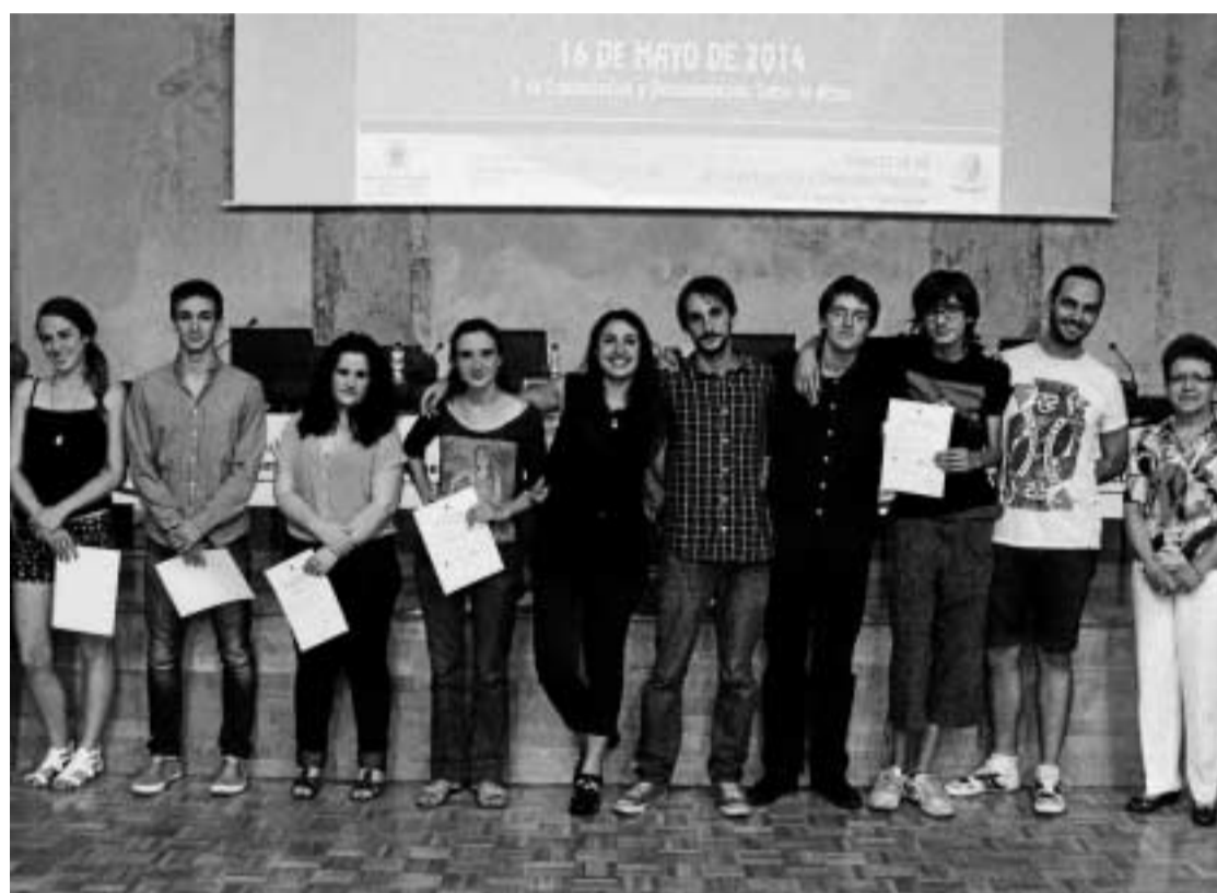
Foto de familia con todos los galardonados en esta primera edición de los premios.