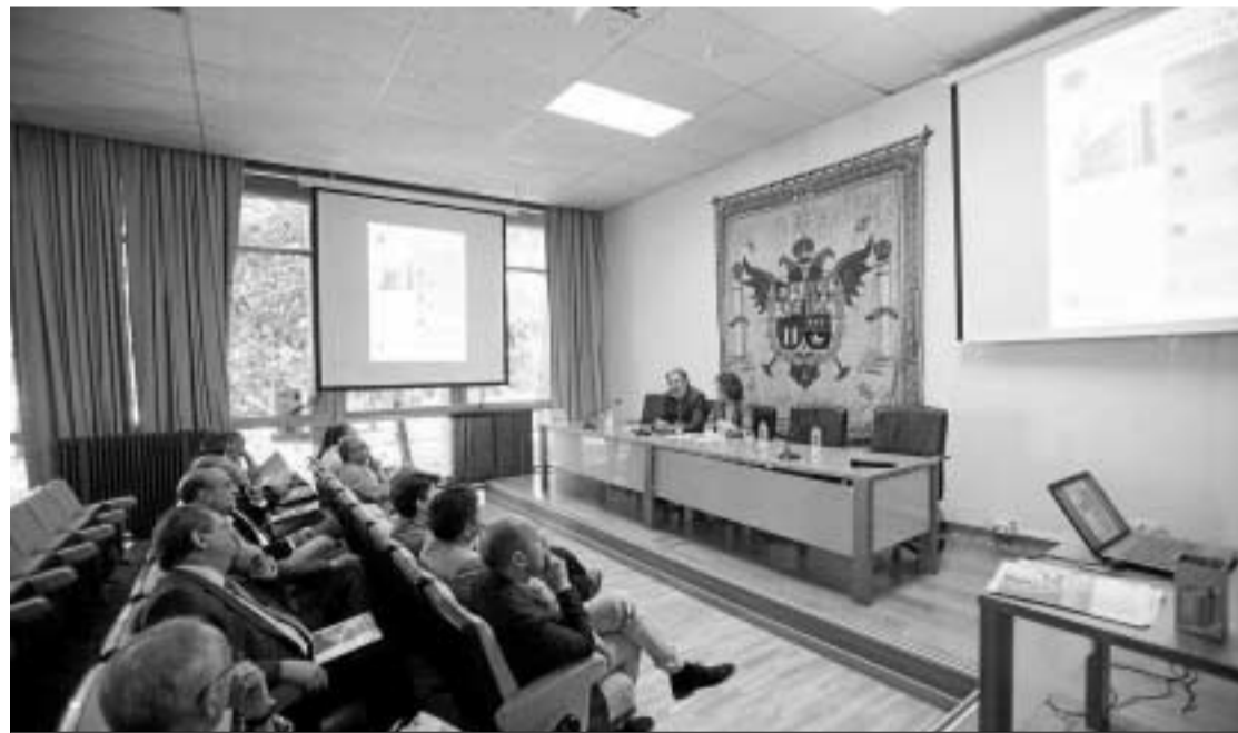
Momento de la conferencia impartida ayer en Filosofía y Letras.