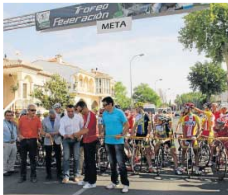
Un momento de la prueba.

Los jóvenes deportistas hicieron las delicias de los vecinos que pudieron presenciarla en municipios como Alhendín cuya Peña Cicloturista fue la responsable de la organización de la prueba, puntuable para el circuito provincial de Granada, con el apoyo de la Diputación Provincial. Con la prueba granadina se ponía el broche final a la tercera edición de este circuito de promoción del ciclismo en ruta, tras las primeras carreras de Jerez de la Frontera (Cádiz), Bollullos Par del Condado (Huelva) y Carmona (Sevilla). Los ganadores de la clasificación general del Trofeo Federación recibirán su reconocimiento en la Gala del Ciclismo Andaluz que se celebrará a finales de año.