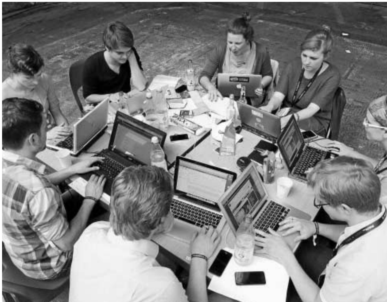
Los universitarios son uno de los principales motivos de las buenas cifras de acceso a internet de la provincia.

● El 72% de los hogares granadinos tienen acceso a internet, el doble que hace apenas seis años ● Un 38% de las familias sin conexión renuncia a ella por su falta de conocimientos