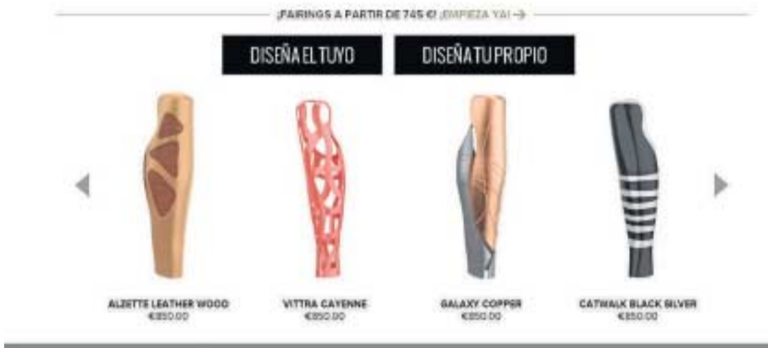
Imagen de la página web de UNYQ donde se ofrecen sus productos y servicios.