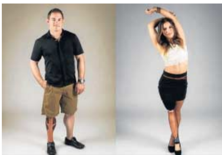
Los usuarios podrán personalizar las fundas de sus piernas ortopédicas.

Los usuarios pueden navegar por la colección on line y elegir la pieza que coincida con su estilo. “Si no, también les cabe la posibilidad de enviar algunos dibujos o fotografías con la idea de diseño que tienen en mente para que el equipo de UNYQ se encargue de