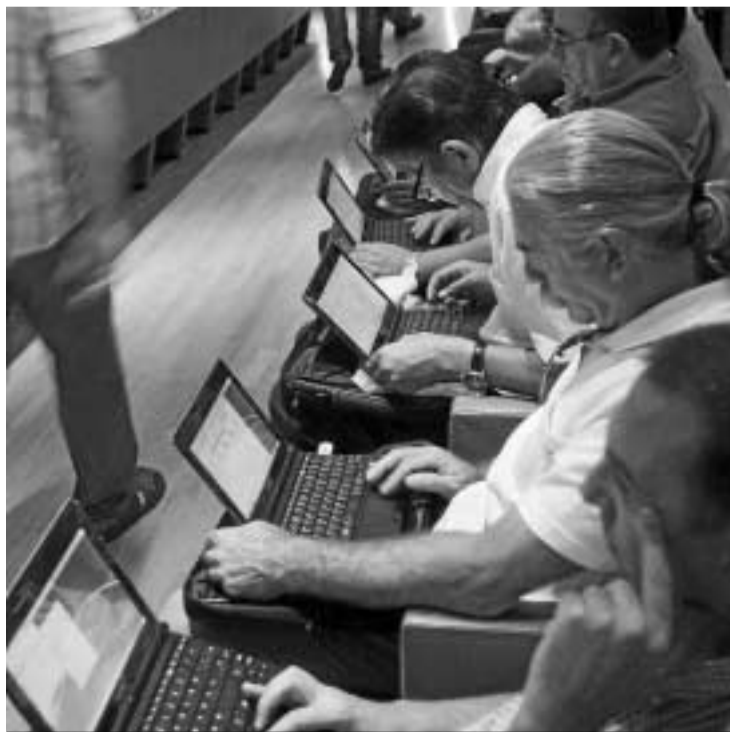
Un 35,3% de los usuarios accede a la red desde su centro de trabajo.

Con motivo del Día de Internet, la Red de Voluntariado Digital, gestionada por Cruz Roja Española en colaboración con la Junta de Andalucía, ha lanzado una campaña para fomentar la participación del voluntariado granadino como vía para superar la brecha digital de la provincia. La iniciativa pretende enseñar de manera gratuita a los ciudadanos a utilizar las nuevas tecnologías a través de acompañantes voluntarios, que mostrarán a los usuarios con inquietudes cómo iniciarse o avanzar en el uso de las nuevas tecnologías, y manejar con mayor soltura dichas herramientas, ya sea para su uso personal o profesional.