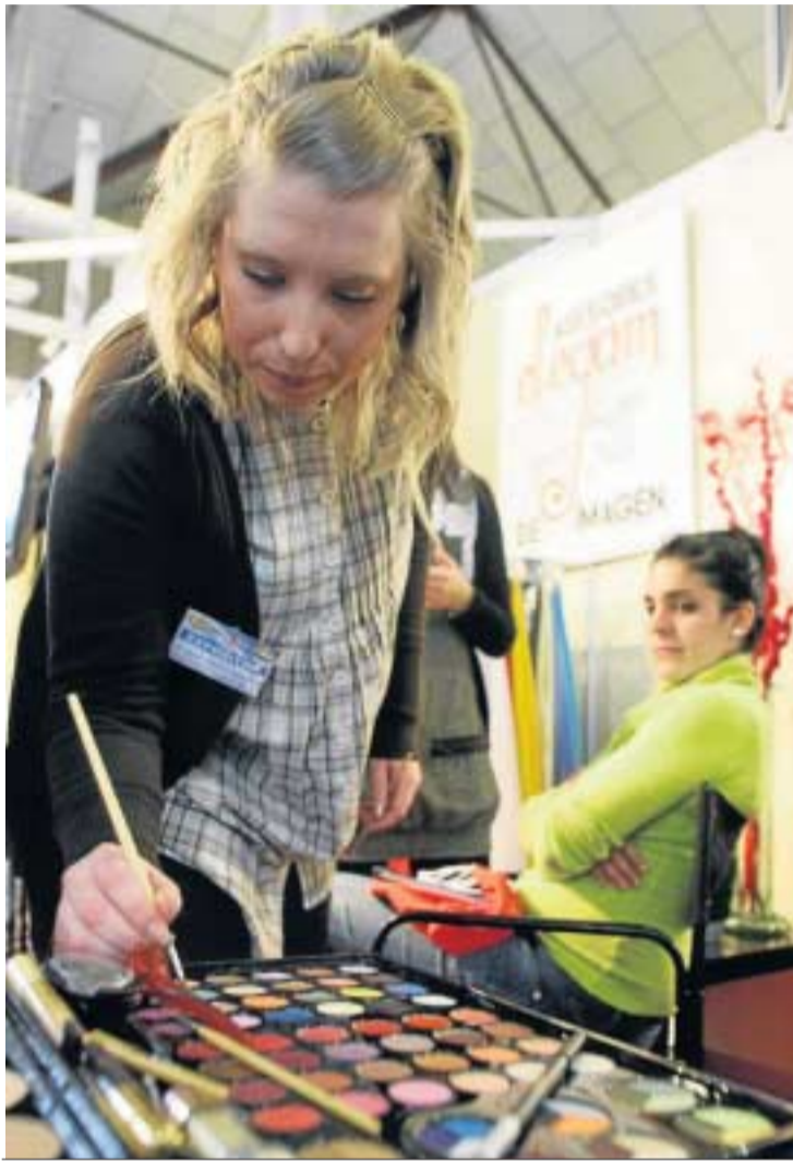
La nueva norma permite el acceso a personas con regímenes especiales.