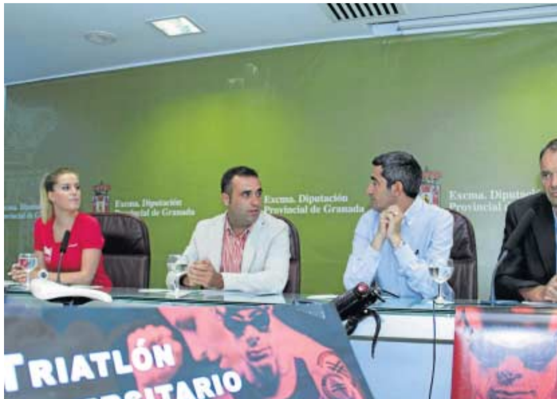
El circuito provincial fue presentado en rueda de prensa.

"Son deportes que de forma individual se están practicando mucho", añadió el diputado de Deportes ante representantes de los