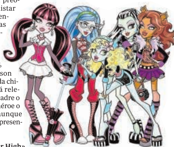
Las «Monster High»

Pero no todo podía ser negativo, y entre las cualidades de las chicas destaca su inteligencia, «en la mayoría de las ocasiones ellas hacen reflexiones sobre situaciones complejas y la forma de resolverlas», concluye Alonso, que en cualquier caso advierte de que después de estas conclusiones, es necesario controlar las series de animación que ven los más jóvenes. «La mayoría de los padres piensan que por ser dibujos animados son inofensivos, pero nada más lejos de la realidad».