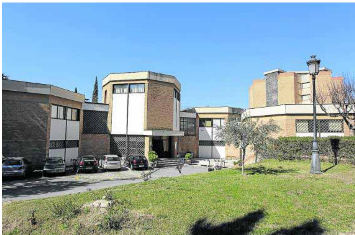
El colegio mayor Loyola ya ha anunciado que cerrará el próximo curso.

La actividad la organiza el Vicedecanato de Estudiantes y Extensión Universitaria junto al proyecto de innovación docente del departamento de Pedagogía 'Patrimonio, educación y sociedad. Construcción de un espacio virtual del patrimonio educativo del alumnado...'