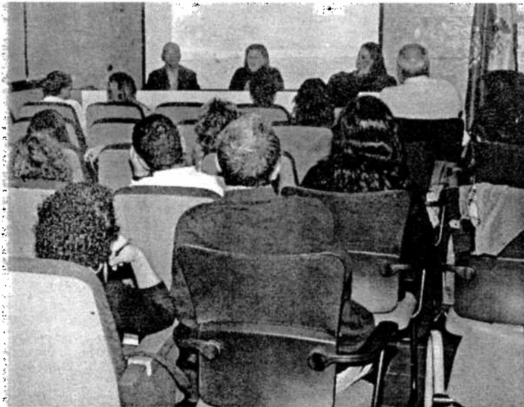
La sala presentaba un gran aforo

La coordinadora del 061 participa en la segunda edición de las jornadas, apuntando que el método de clasificación de las víctimas es crucial en incidentes multitudinarios