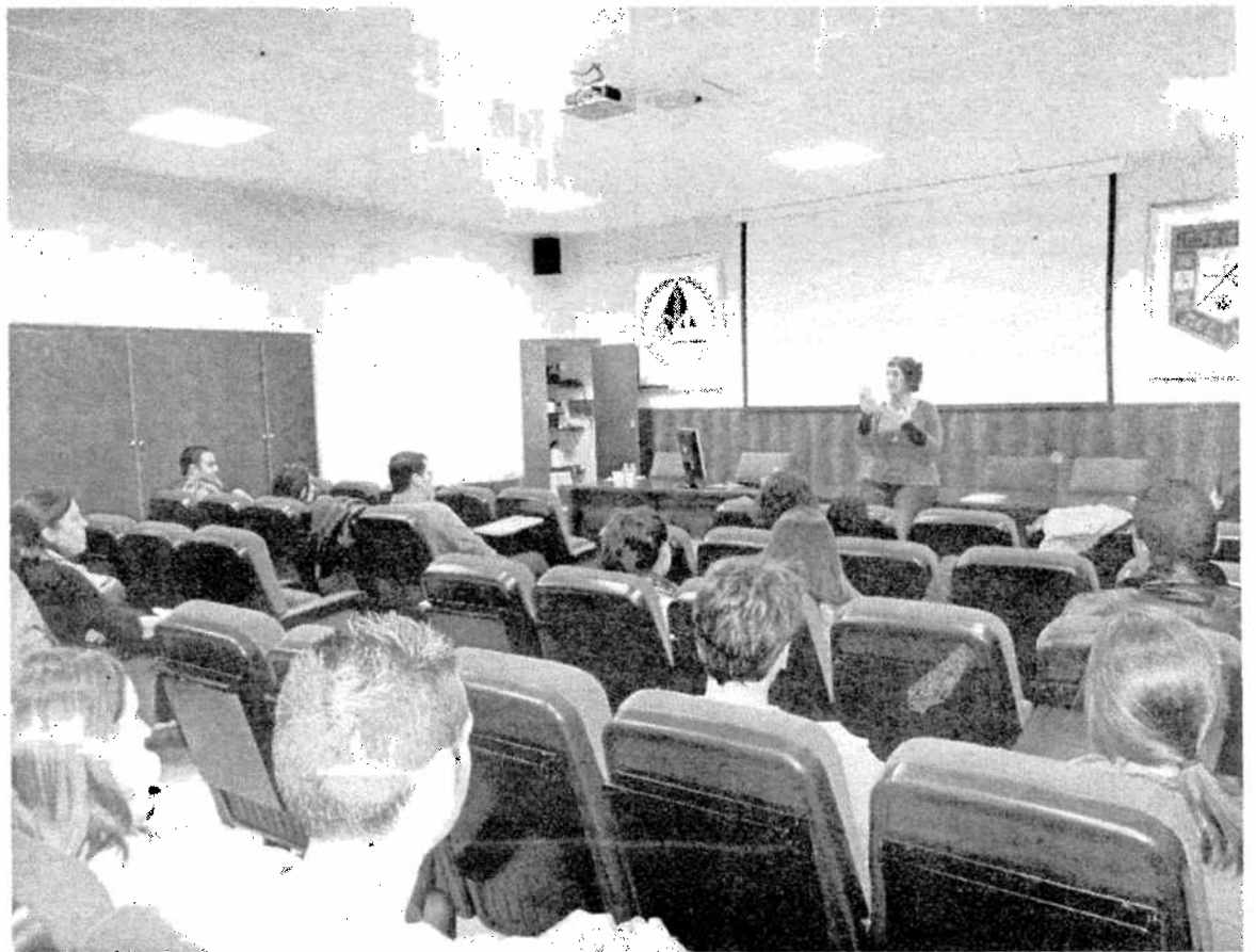
El curso cuenta con 22 ponencias

Melilla siempre ha sido fruto de Interculturalidad y se hace desde las aulas. Los profesores de la ciudad se encuentran con muchos problemas que les llevan diariamente a plantearse retos educativos y también tareas de investigación para poder mejorar los resultados de sus alumnos, ya que al fin y al cabo, son a los que se deben, y es lo que se abordará a lo largo de estas ponencias.