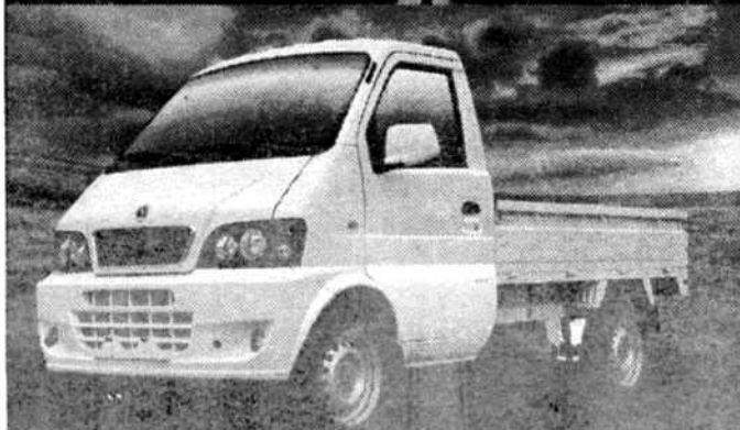
MINICAMIÓN CABINA FIJA