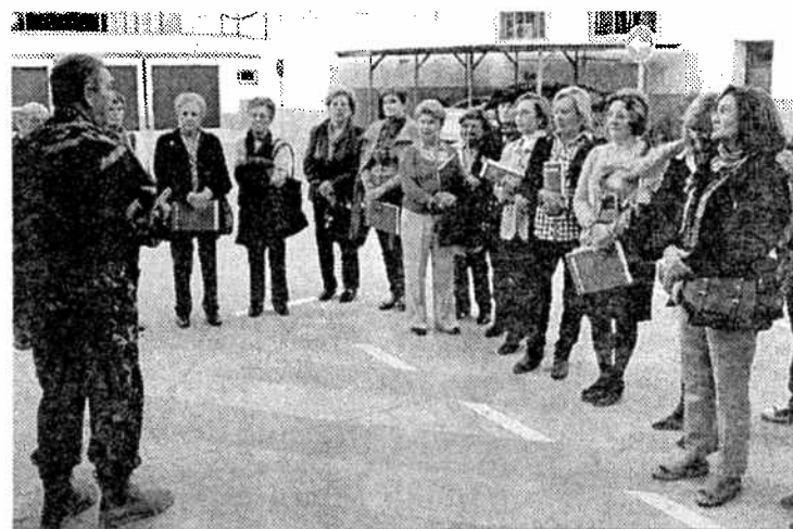
Los alumnos atienden la explicación del personal de la Biblioteca Militar.

Los colectivos que estén interesados en realizar esta visita guiada, como hicieron los alumnos de la UGR, deben solicitarla previamente en la dirección de correo electrónico centro_historia_cultura_militar_melilla@et.mde.es.