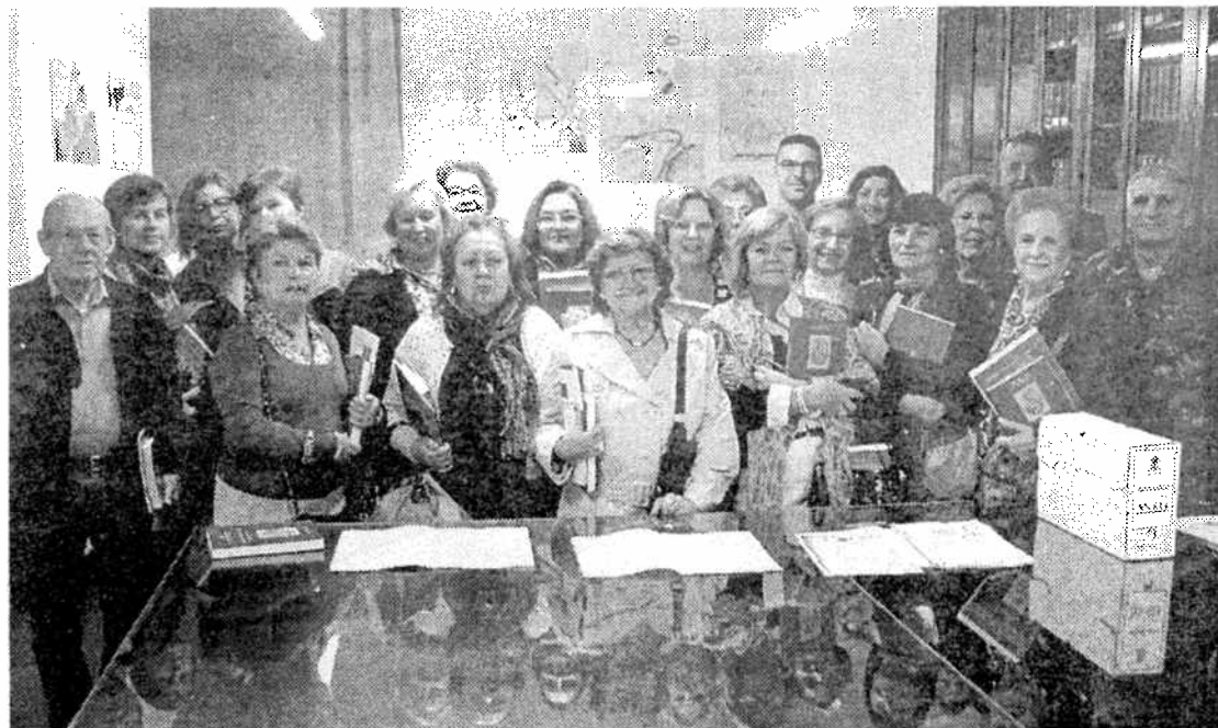
Los estudiantes se hicieron la tradicional foto de familia al finalizar la visita en el Archivo Intermedio.

Posteriormente, los alumnos visitaron la Biblioteca Militar, de acceso público, donde además de facilitar libros de lectura de todo tipo en calidad de préstamo, posee importantes fondos bibliográficos que utilizan investigadores, escritores e historiadores venidos en ocasiones desde la península, para después publicar libros, artículos en revistas especializadas o