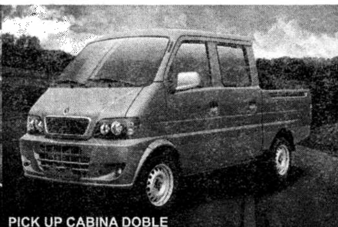
PICK UP CABINA DOBLE