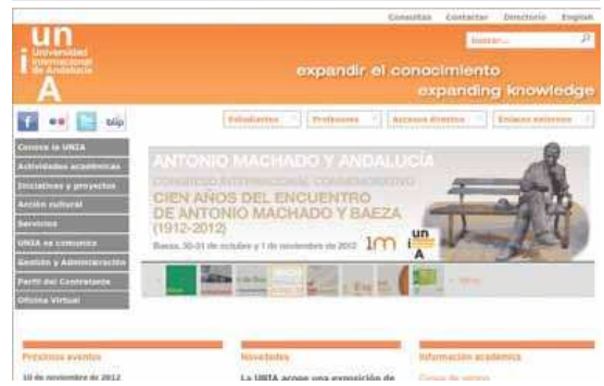
Imagen de la portada de la Web de la UNIA