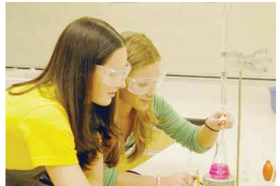
1000 investigadores y 100 ayudantes podrían perder sus empleos

Al cierre de esta edición, este periódico no consiguió contactar con la UGR para obtener datos oficiales acerca de este tema.