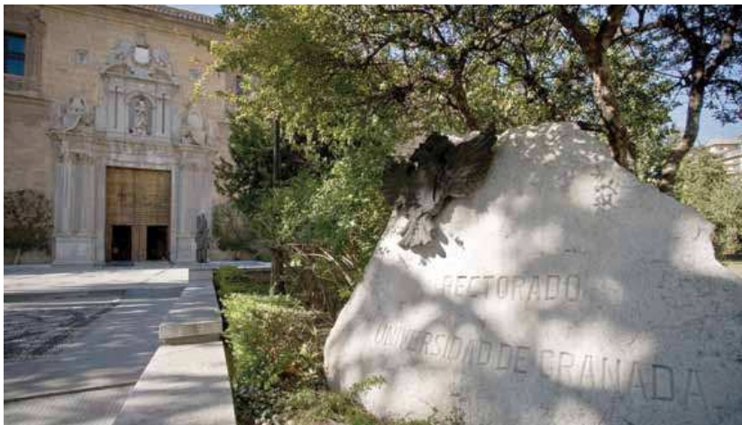
Un momento de la rueda de prensa preX

El edificio, que alberga la sede del Rectorado de la Universidad de Granada, cumple 30 años en esta función y lo celebra con una exposición