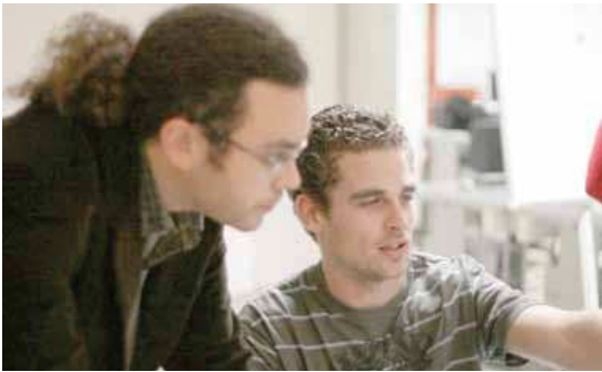
El curso tendrá una metodología participativa