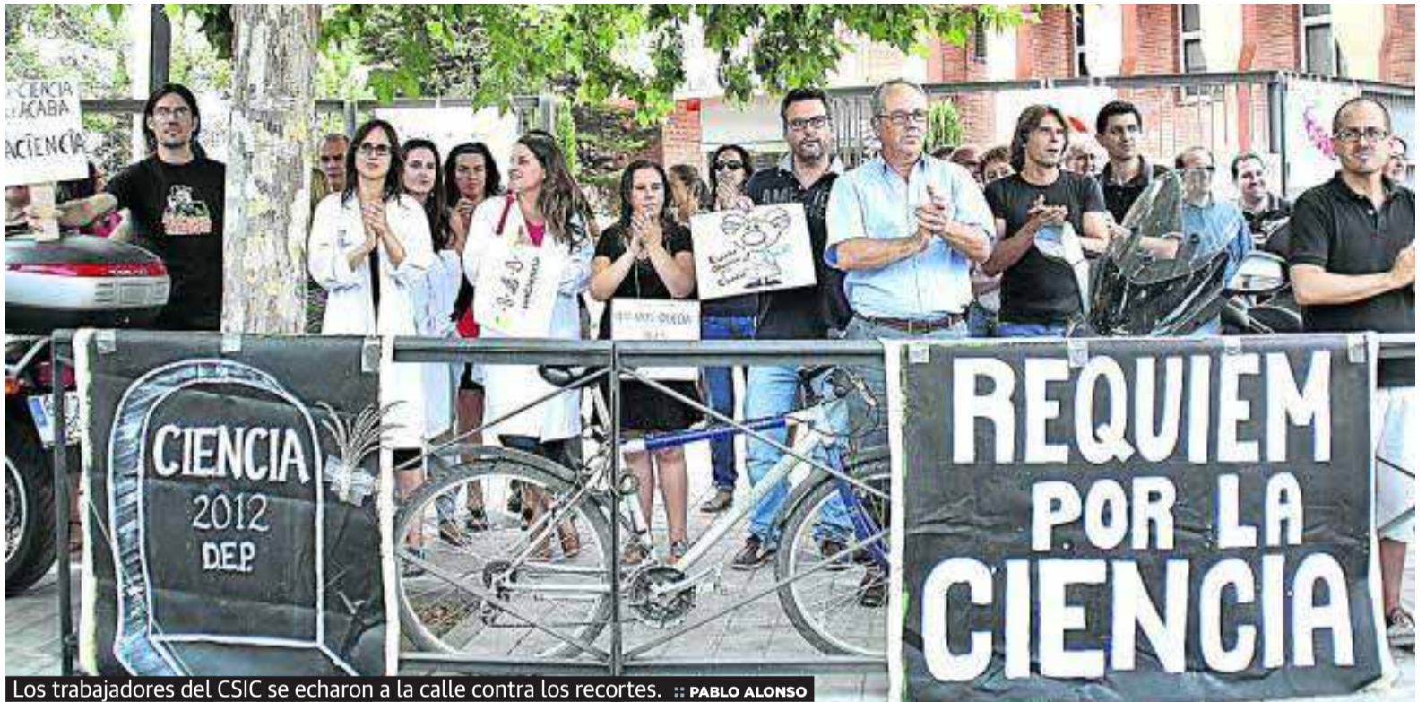
Los trabajadores del CSIC se echaron a la calle contra los recortes.

Cerca de doscientos trabajadores de los cinco centros del Consejo Superior de Investigaciones Científicas (CSIC) en Granada se concentraron ayer de manera conjunta y durante media hora como medida de protesta contra los recortes en ciencia. En la movilización, celebrada en la Glorieta de la Astronomía de Granada, participaron empleados de la Estación Experimental del Zaidín, el Instituto de Parasitología y Biomedicina López Neyra, el Instituto Andaluz de Ciencias de la Tierra, la Escuela de Estudios Árabes y el Instituto de Astrofísica de Andalucía, según explicó un portavoz de los congresados.