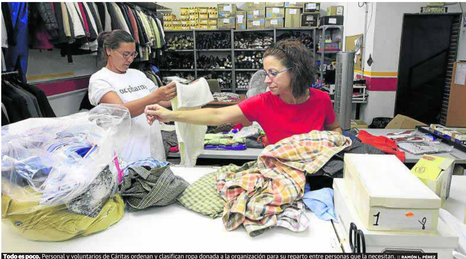
Todo es poco. Personal y voluntarios de Cáritas ordenan y clasifican ropa donada a la organización para su reparto entre personas que la necesitan.

más el pasado año en donativos, cantidad que ha permitido aumentar también la ayuda a familias necesitadas. Cáritas presta auxilio ya a más de 15.000 personas en apuros. CARMEN TÉBAR P2 Y 3