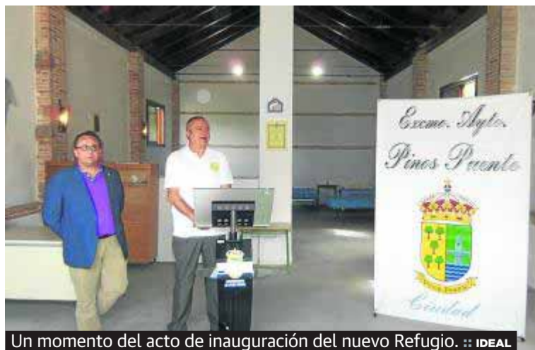
Un momento del acto de inauguración del nuevo Refugio.

Se trata de una edificación construida en piedra que cuenta con una estancia de 150 metros cuadrados totalmente diáfana con techos acabados con artesonados de madera, y contará en principio con media docena de camas, que se irán ampliando a medida que sea necesario.