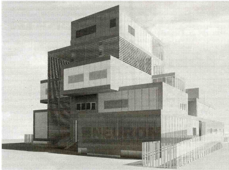
Neuron Bio se encuentra entre las empresas biotecnológicas más innovadoras.

Este Programa señala como objetivos específicos la mejora de la financiación de las empresas; acercar la biotecnología a los sectores productivos andaluces, en concreto al agroalimentario y sanitario; mejorar la formación de los recursos humanos ocupados en el sector; desarrollar nuevas infraes-