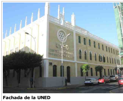
Fachada de la UNED

El Centro Asociado de la UNED y el CentroD2 celebrarán durante los días 15 y 16 de mayo la I Feria de Idiomas de Melilla, un evento llevado a cabo con la colaboración de la Consejería de Educación y Colectivos Sociales y el Campus de la Universidad de Granada (UGR), instituciones muy sensibilizadas con la importancia de los idiomas en el actual contexto socioeconómico, en el que muchos jóvenes se plantean la posibilidad de emigrar como única salida posible en sus vidas laborales.