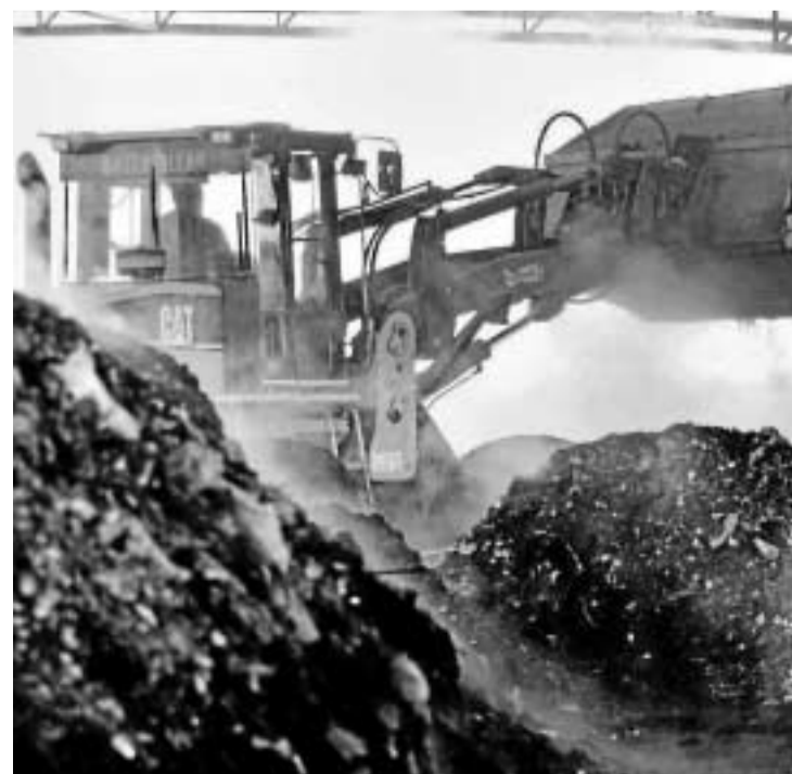
Imagen de la planta de Alhendín, donde está la máquina denunciada.

El diputado resaltó el esfuerzo que tiene que acometer ahora el equipo de gobierno. "Han tenido que pasar diez años para que un gobierno del PP le enmiende la plana (por el PSOE). Contrataron la máquina, la usaron y no pagaron un euro. Las instituciones deben ser un ejemplo de gestión y debemos dar ejemplo a todos los granadinos. ¿Se imaginan hasta dónde podría llegar una pequeña empresa con esta deuda? Sería incapaz de asumir una deuda tan elevada durante tanto tiempo".