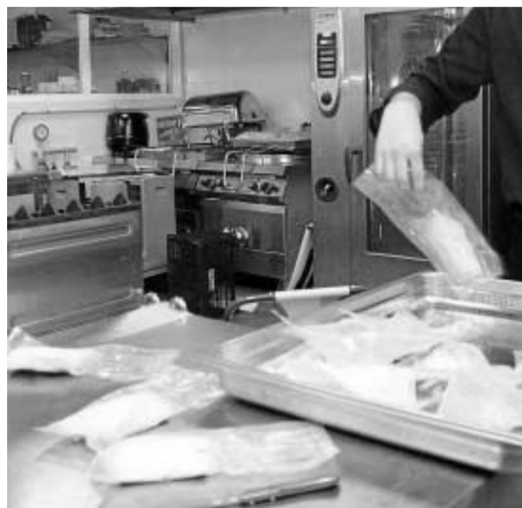
El ‘anisakis’ se contagia al comer pescado mal elaborado.

Esa circunstancia es lo que puede estar motivando, según los investigadores, el repunte de casos