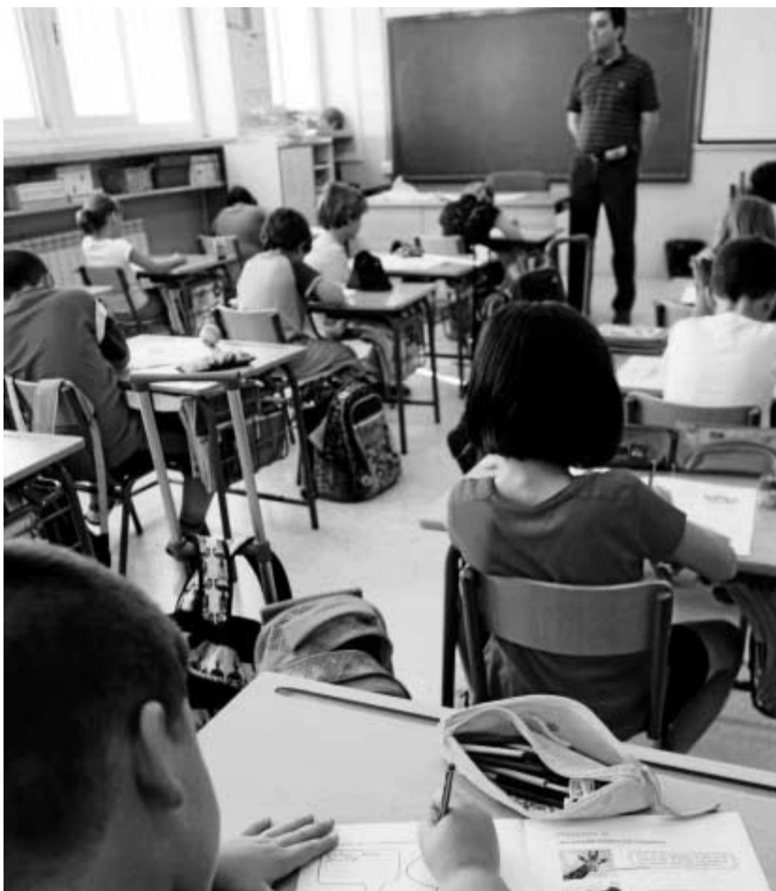
Alumnos de un colegio de la provincia se examinan de la prueba Escala.

El Gobierno andaluz realiza desde hace seis años las pruebas de diagnóstico y las de competencias básicas (Escala), las mismas para toda la comunidad, con el objetivo de conocer el nivel de competencia que tienen los alumnos de Primaria y Secundaria. Aunque el profesorado insiste en que es difícil evaluar los conocimientos de los escolares con estos exámenes, suponen un buen instrumento de control interno para