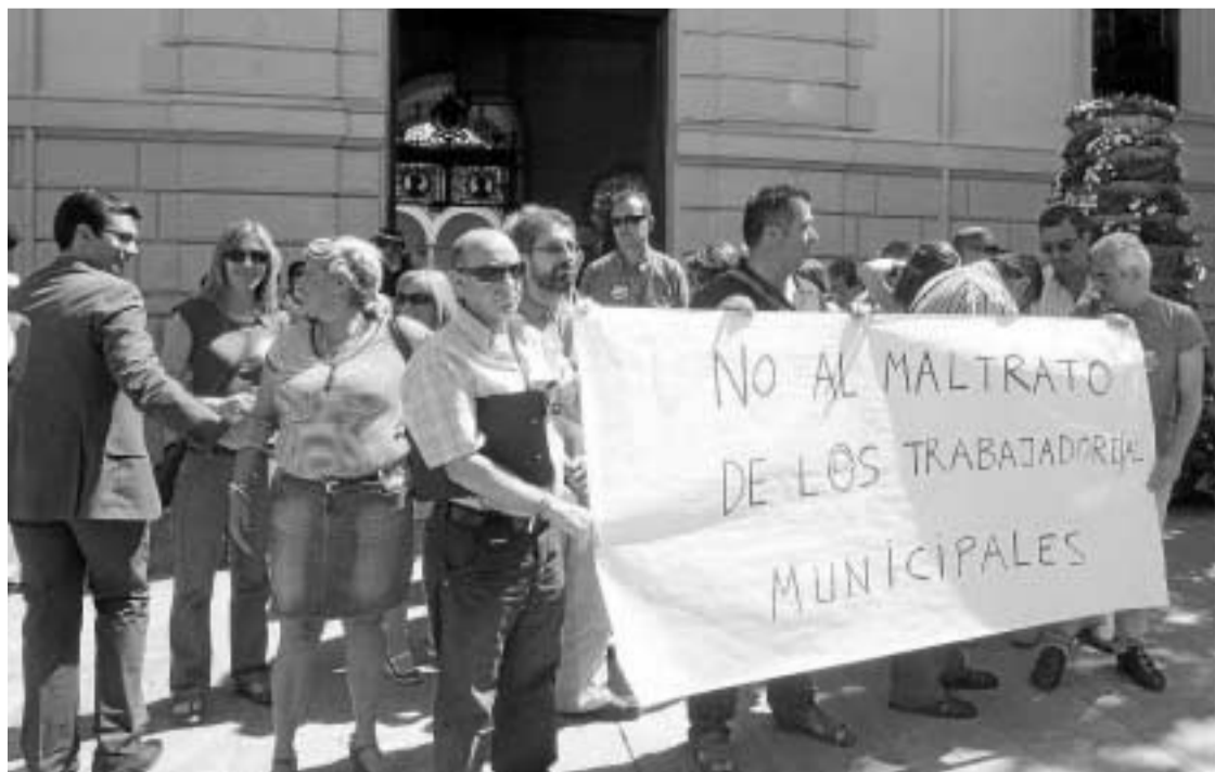
Un momento de la concentración de trabajadores en la puerta del Ayuntamiento.

Además, para el concejal, dicha afirmación carece por completo de sentido, cuando "la mayoría de funcionarios ha comprendido cómo la situación económica afecta a los ayuntamientos y la necesidad y orientación de las medidas de ajuste". Al edil le sorprenden lo que se está pidiendo "en un momento en que el Ayuntamiento apuesta por la austeridad y la calidad en la prestación de los servicios".