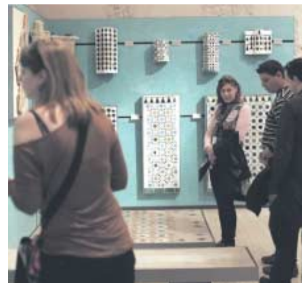
El Museo de la Alhambra amplía su horario de visitas. G.H.

El Patronato de la Alhambra y Generallife amplía el horario de apertura y cierre de puertas del Museo de la Alhambra. A partir de mañana miércoles, día 16 de mayo, el Museo, ubicado en el interior del Palacio de Carlos V, abrirá a las 8:30h y cerrará a las 20:00h de marzo a octubre, y hasta las 18:00 de octubre a marzo, de miércoles a sábados. Con ello, el museo amplía la oferta cultural y educativa que presta a los ciudadanos que quieren disfrutar, conocer y valorar el patrimonio que atesora la pinacoteca.