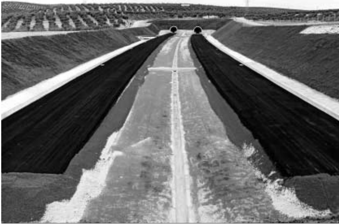
Los trabajos cuentan con una inversión de más de 38 millones.