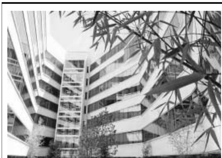
Diputación provincial de Granada.

La Diputación de Sevilla obtiene 45 puntos, seguida de la de