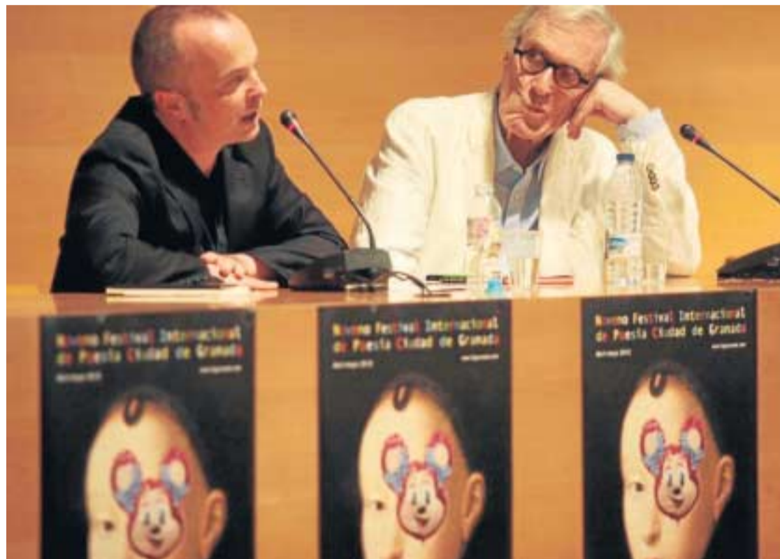
El poeta norteamericano, ayer durante su lectura.

Ganador del premio Pulitzer, el poeta norteamericano es una de las máximas figuras de la literatura en lengua inglesa