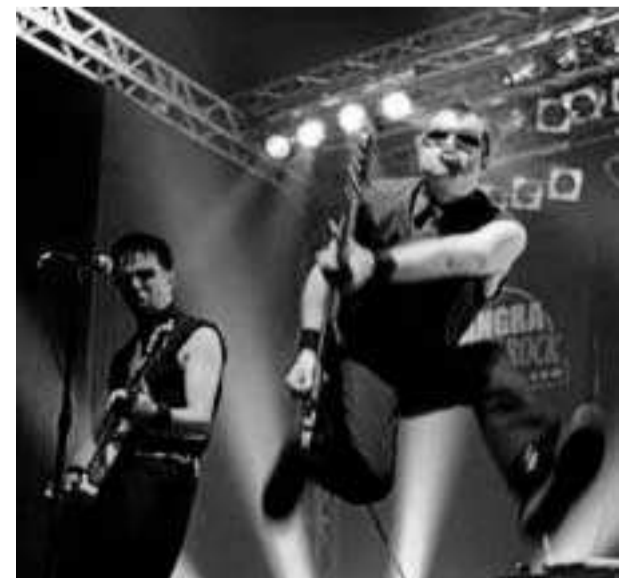
La banda, en plena actuación.

The Toy Dolls, una de las bandas claves del punk en todo el mundo, aterriza esta noche en la sala El Tren dentro de su gigantesca gira internacional que muchos dicen que puede ser de despedida. La banda, con más de una quincena de discos en su trayectoria, llega con los nuevos temas de The album after the last one . El concierto, que comenzará a las 22.00 horas, contará con No Relax y los granadinos Zutaten como artistas invitados para ir calentado el ambiente.