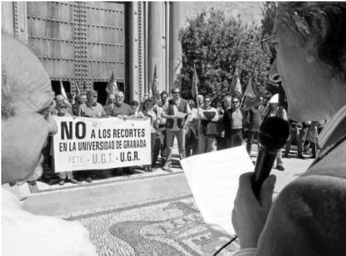
Un momento de la concentración de ayer.

Creen que la aplicación del decreto atentaría contra la autonomía universitaria ● Piden a Lodeiro que se sume al resto de rectores