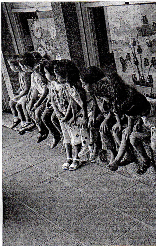
La Inmaculada, S. Daniel y Gª Lorca han recibido las mayores peticiones.

Efectivamente, el gesto no supone ninguna novedad con respecto a lo acontecido durante los últimos cursos. El corriente, para no ir más lejos, arrancó con el 70% de las clases de 3 años por encima del límite legal fijado en 25 estudiantes. Nin-