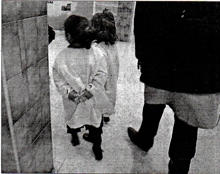
Durante la movilización se dará lectura a un manifiesto consensuado en defensa de la Educación Pública.

EL PUEBLO / CEUTA. El próximo viernes 27, a partir de las 18.30 horas, tendrá lugar en el Salón de Actos del Palacio Autonomo el acto de entrega de premios del concurso de dibujo 'Las aves de Ceuta', organizado por la Sociedad de estudios Ornitológico de Ceuta y el Grupo de Anillamiento 'Chagra'. El concurso, realizado a través de la Guía Educativa 'Ceuta te enseña' está dirigido a alumnos de 5º y 6º de Primaria y el primer ciclo de ESO y ha consistido en la realización de un dibujo de un ave urbana que se pueda observar en la ciudad. Más de cien escolares han participado en el concurso. El acto de entrega incluye una charla.