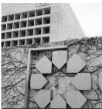
Sede de CajaGranada.

El preacuerdo gira en torno a cuatro medidas, la primera de las cuales consiste en bajas voluntarias e incentivadas de 150 personas, con una indemnización de 45 días por año con un tope de 42 mensualidades, por encima de la propuesta de la empresa de 20 días por año con un tope de 12 mensualidades, según Guirao. La segunda medida contempla un programa de entre 100 y 150 suspensiones de contratos por seis meses, cuya