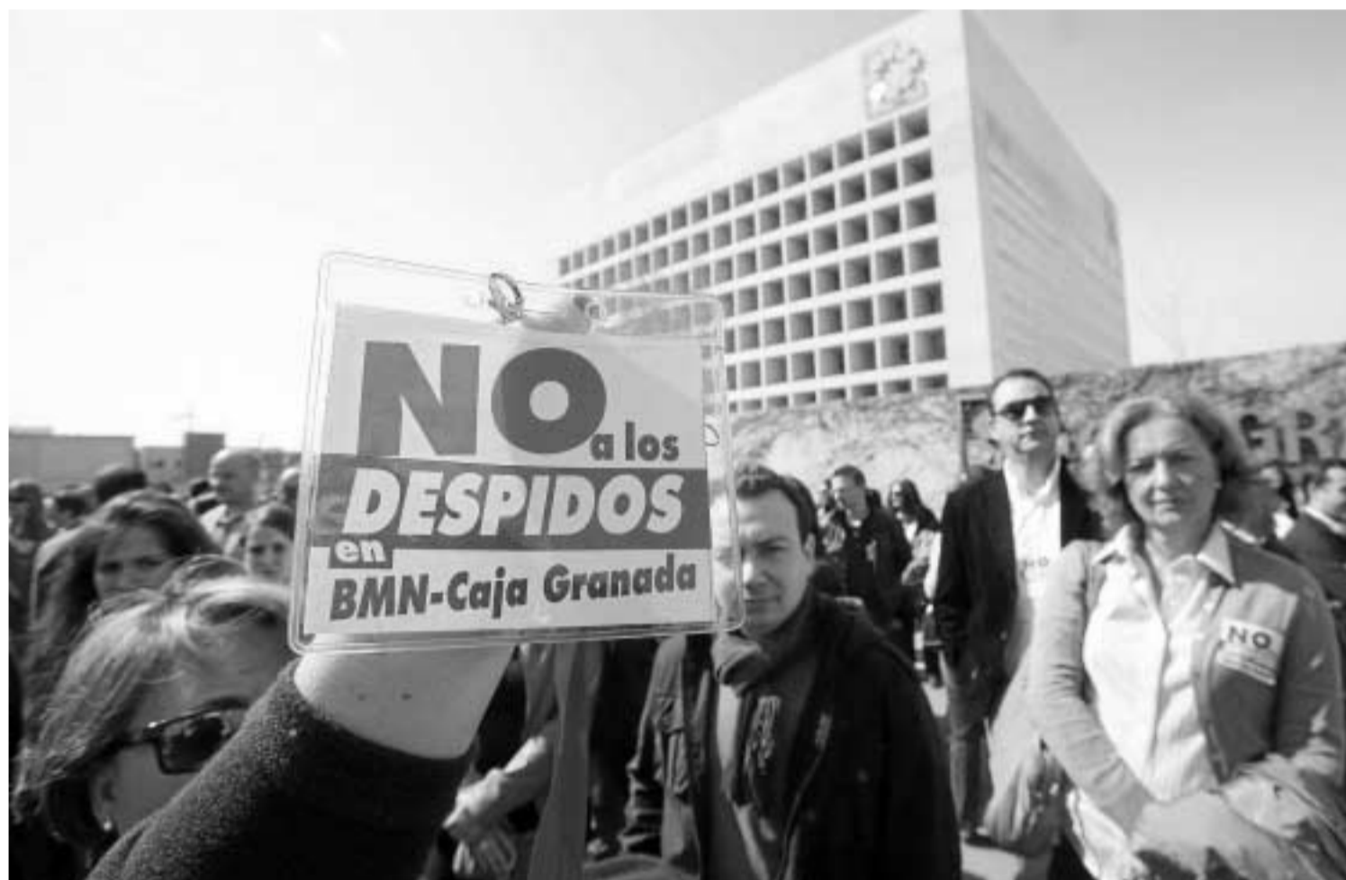
Imagen de archivo de una de las protestas que han llevado a cabo los trabajadores de BMN.

Se ha llegado a un preacuerdo para evitar la salida de 650 trabajadores anunciada en febrero tras la fusión de las cuatro cajas y también se ha impedido el cierre de 120 oficinas de las entidades