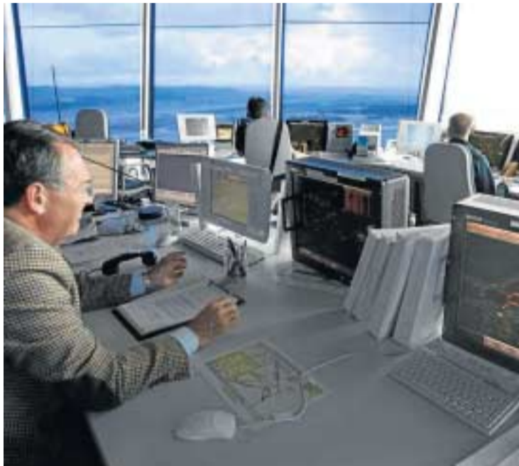
Las rotaciones en los turnos de trabajo obligan a romper el sueño.

Durante seis semanas, 21 personas sanas participaron en este estudio de laboratorio a corto plazo.