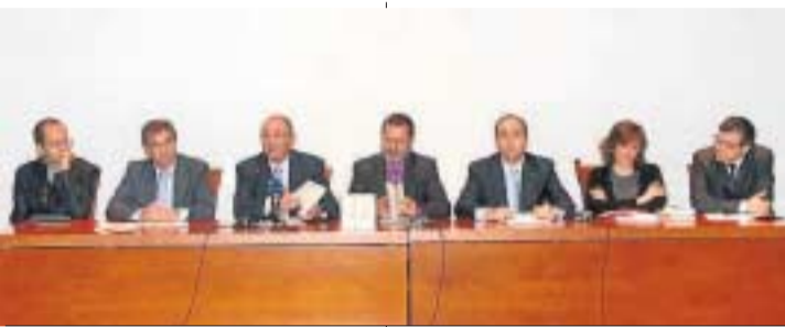
Presentación de la feria, ayer, en la Biblioteca de Andalucía. PEPE TORRES