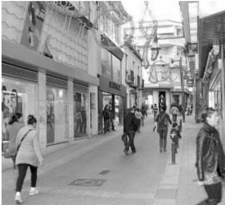
En la localidad costera muchos de los terremotos no se sintieron.

Sin embargo, durante toda la jornada se produjeron movimientos sísmicos en la misma zona, que produjeron pequeñas vibraciones, algunas imperceptibles. Hasta 29 se habían producido hasta las cuatro y media de la tarde, con intensi-