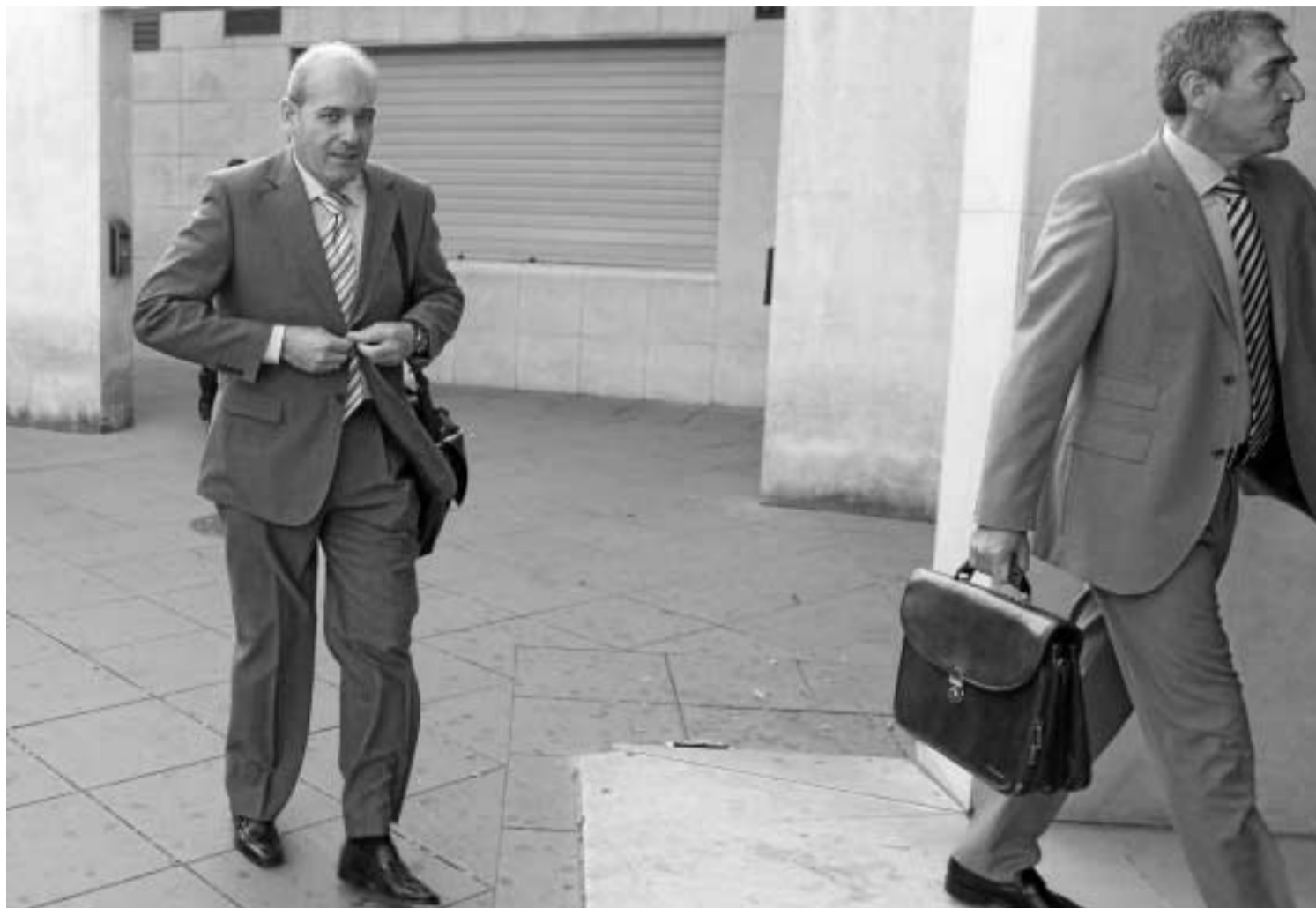
Una imagen de archivo de Sánchez llegando a los juzgados de la Caleta.