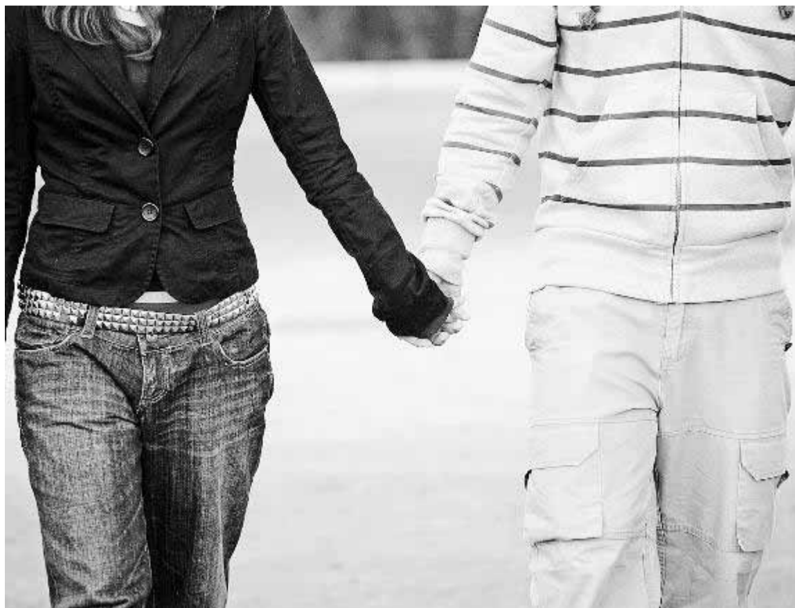
Las parejas que se deshacen cada vez son más en Granada, siempre hay otra oportunidad. :: R. L. PÉREZ.

Otra cuestión que, según el sociólogo, influye en que la cifra de divorciados que se vuelven a casar se dispare en los últimos años es la mejora de las condiciones de vida actuales y la mayor esperanza de