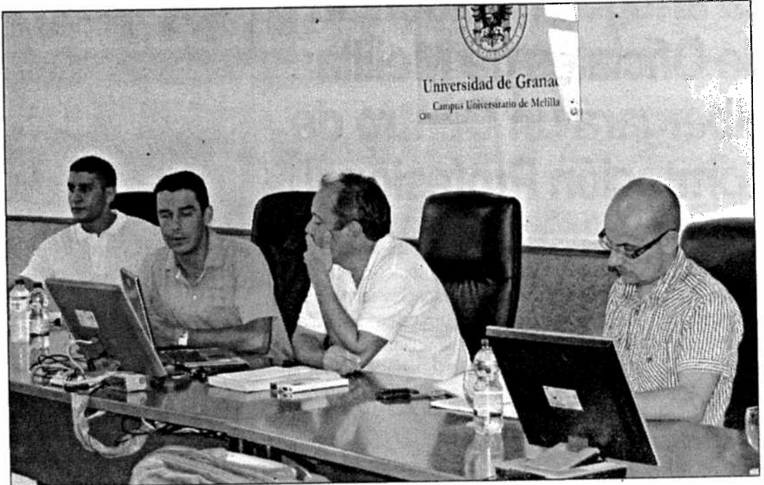
La semana pasada se presentaron dos estudios sobre movilidad

Cualquier medio de transporte supone la ocupación de cierta cantidad de espacio, tanto para su circulación como para su aparcamiento. El espacio público consumido depende del volumen de los vehículos, de la cantidad