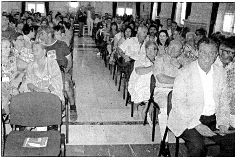
Hasta Melilla se han trasladado más de cien representantes de diferentes colegios