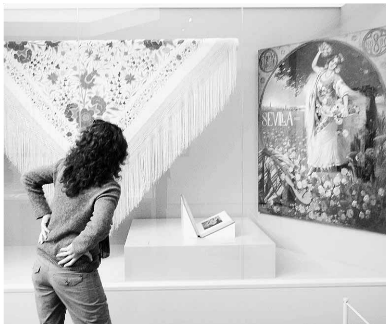
Una visitante de la muestra de Matisse, ya clausurada.

Más de un centenar de piezas se han exhibido en esta muestra, entre las que se han reunido 35 obras de Matisse desde óleos, dibujos, li-