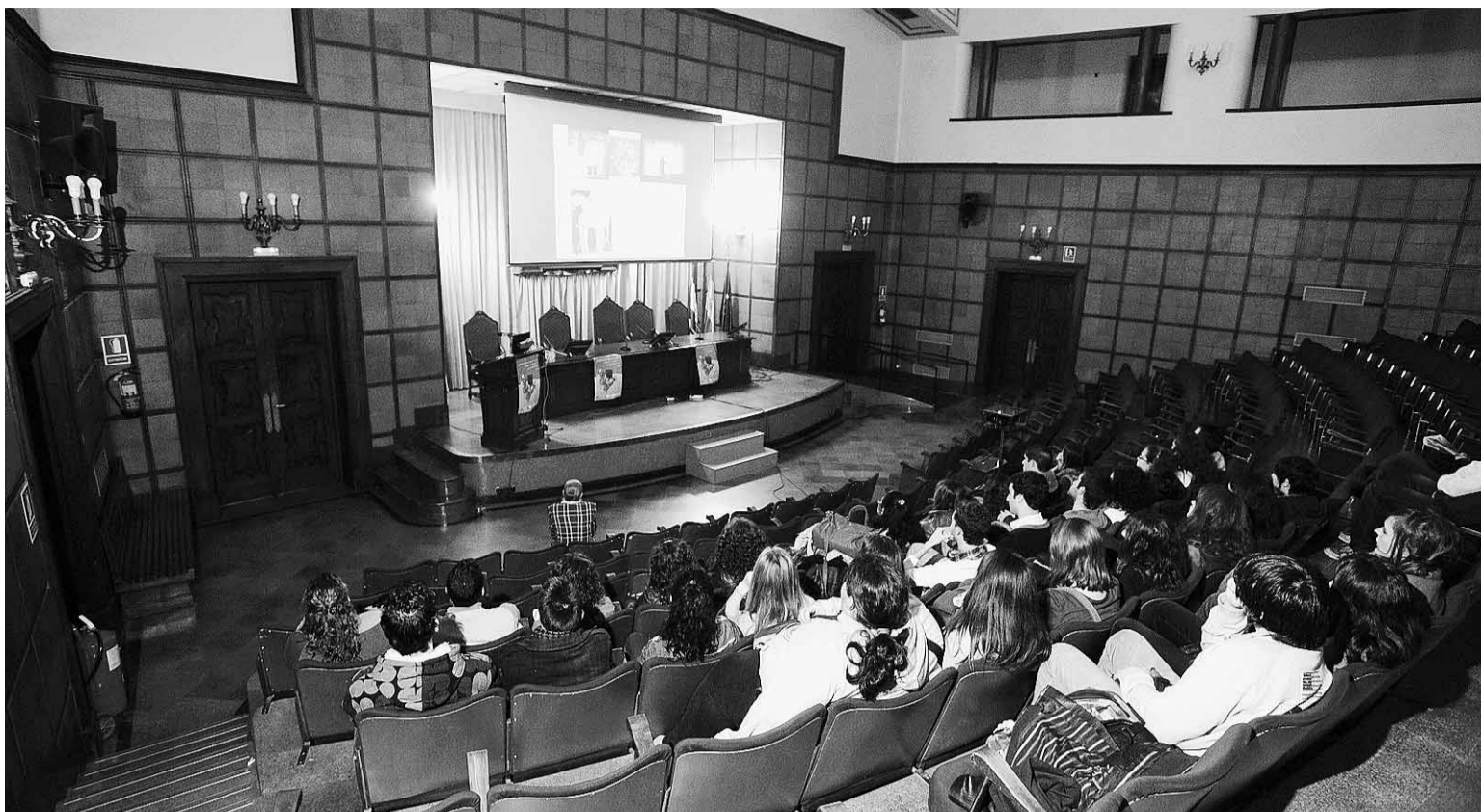
La facultad de Farmacia abrió sus puertas a estudiantes de Bachillerato.