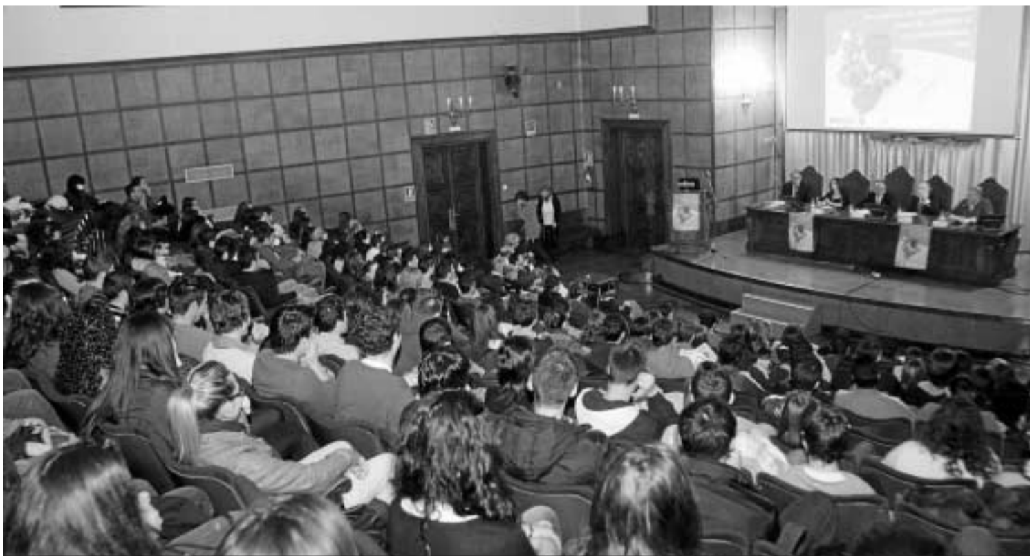
Estudiantes de Bachillerato, ayer, en las jornadas de orientación de la UGR en la Facultad de Medicina.