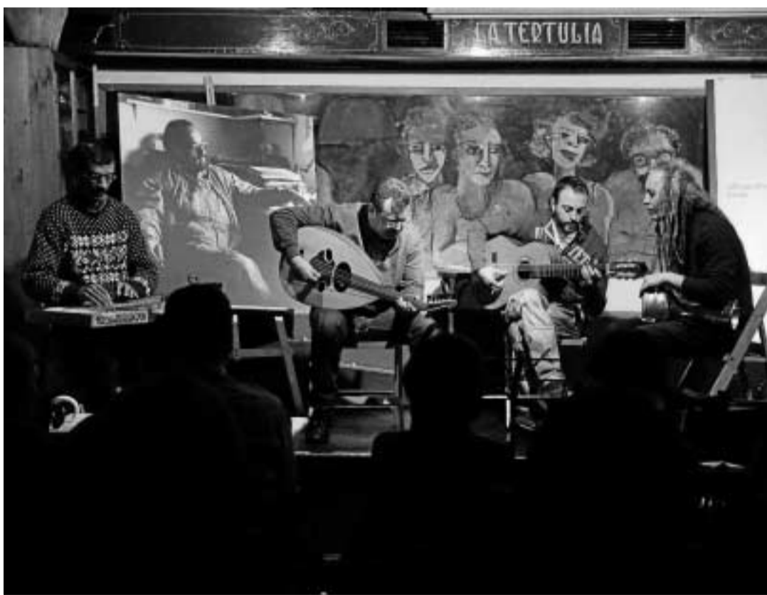
Un instante del homenaje al cantautor Esteban Valdivieso en La Tertulia.

La gira de Nacho Vegas también pasará por Granada, Cádiz, Sevilla, Málaga o Valencia.