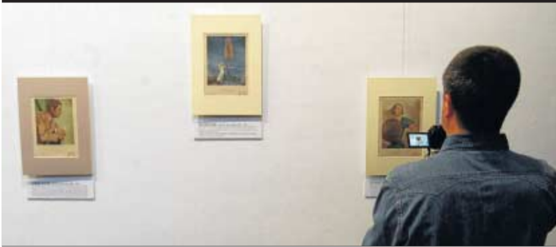
Entre las láminas expuestas se pueden ver a actrices españolas como Rosita Díaz Gimeno.