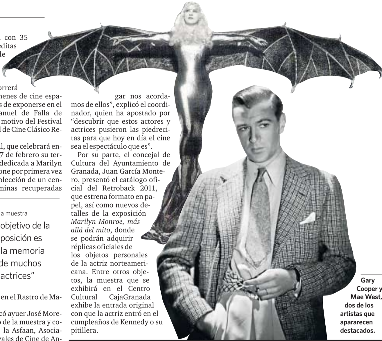
Gary Cooper y Mae West, dos de los artistas que aparecen destacados.

Por su parte, el concejal de Cultura del Ayuntamiento de Granada, Juan García Montero, presentó el catálogo oficial del Retroback 2011, que estrena formato en papel, así como nuevos detalles de la exposición Marilyn Monroe, más allá del mito , donde se podrán adquirir réplicas oficiales de los objetos personales de la actriz norteamericana. Entre otros objetos, la muestra que se exhibirá en el Centro Cultural CajaGranada exhibe la entrada original con que la actriz entró en el cumpleaños de Kennedy o su pitillera.