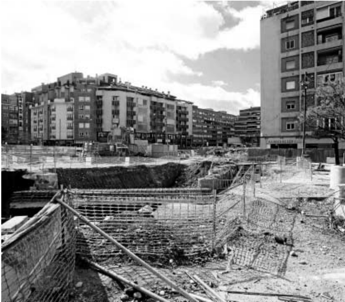
Estado de las obras en la Plaza Einstein de la capital.