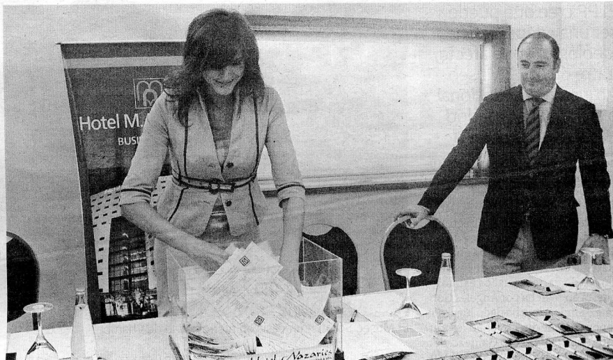
La representante de Cervezas Alhambra fue la mano inocente del sorteo celebrado ayer.