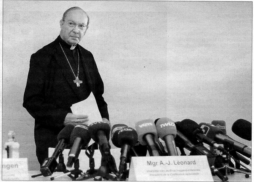
El cardenal primado de Bélgica, André-Joseph Léonard, ayer en Bruselas.

“Estas historias y el sufrimiento que contienen nos hacen temblar”, aseguró ayer Léonard en referencia al informe del psiquiatra infantil Peter Andriaenssens hecho público el viernes sobre los abusos padecidos por casi medio millar de menores. El primado perdió la ocasión de dar fuerza y credibilidad a su dolor al no pedir explícitamente perdón a las víctimas, al menos 13 de las cuales optaron por el suicidio. También desmereció la ocasión otro obis-