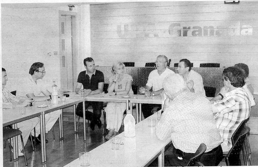
Representantes de la comunidad de regantes Acequia de San Luis en la firma del acuerdo ■ A. MANSILLA.

Según UPA y UGT, los pozos de la agroindustria afectaron al manantial de Hernán Valle hasta el punto de que éste ha pasado de 27 litros por segundo a dos, por lo que hace inviable las explotaciones de los agricultores que forman parte de la comunidad. Los regantes denunciaron la situación ante la Guardia Civil con