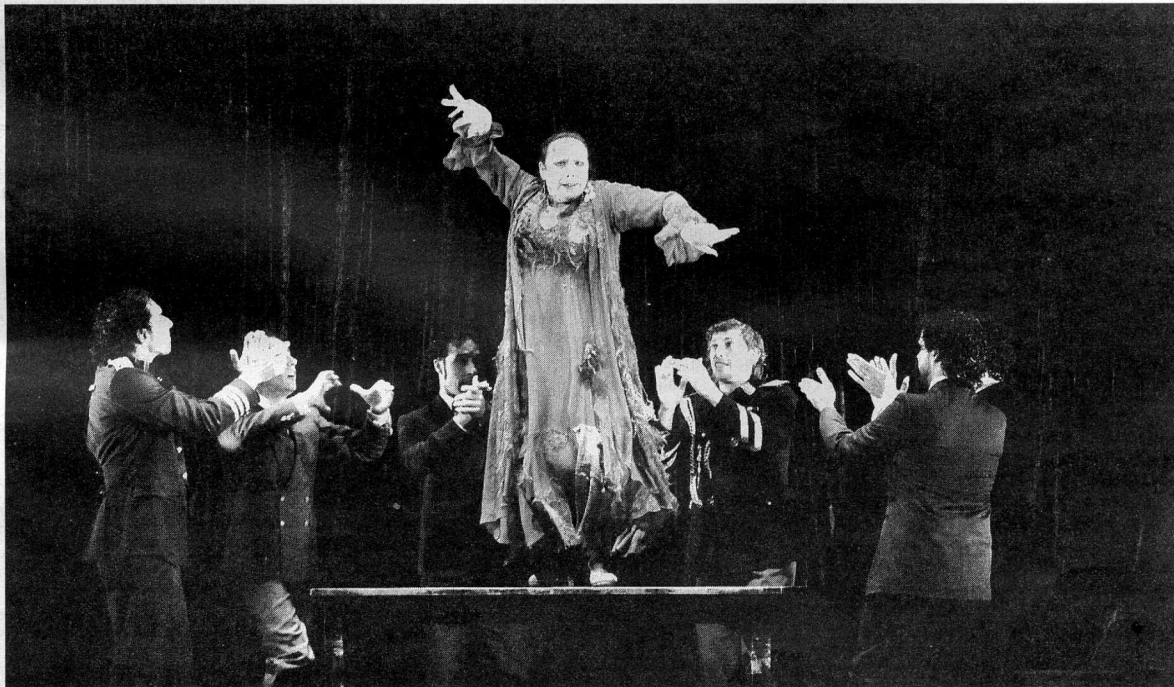
Cristina Hoyos en un momento del espectáculo.

'Poema del cante jondo' es un espectáculo de gran formato de hon-