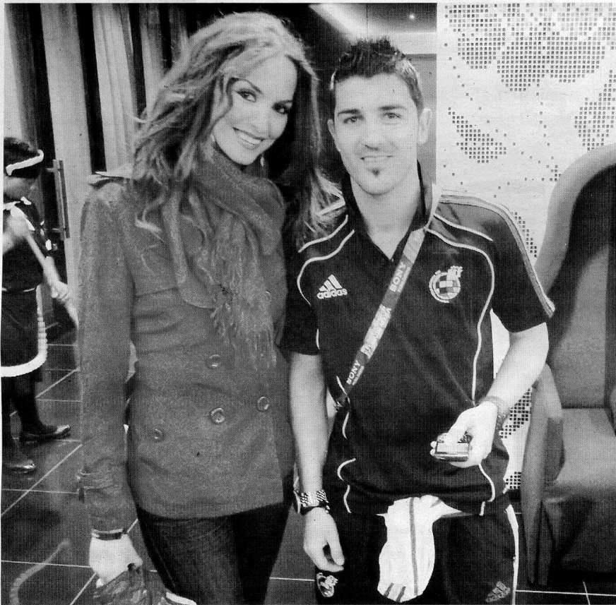
La miss granadina posa con Villa en una de sus fotografías preferidas. ■ R. I.