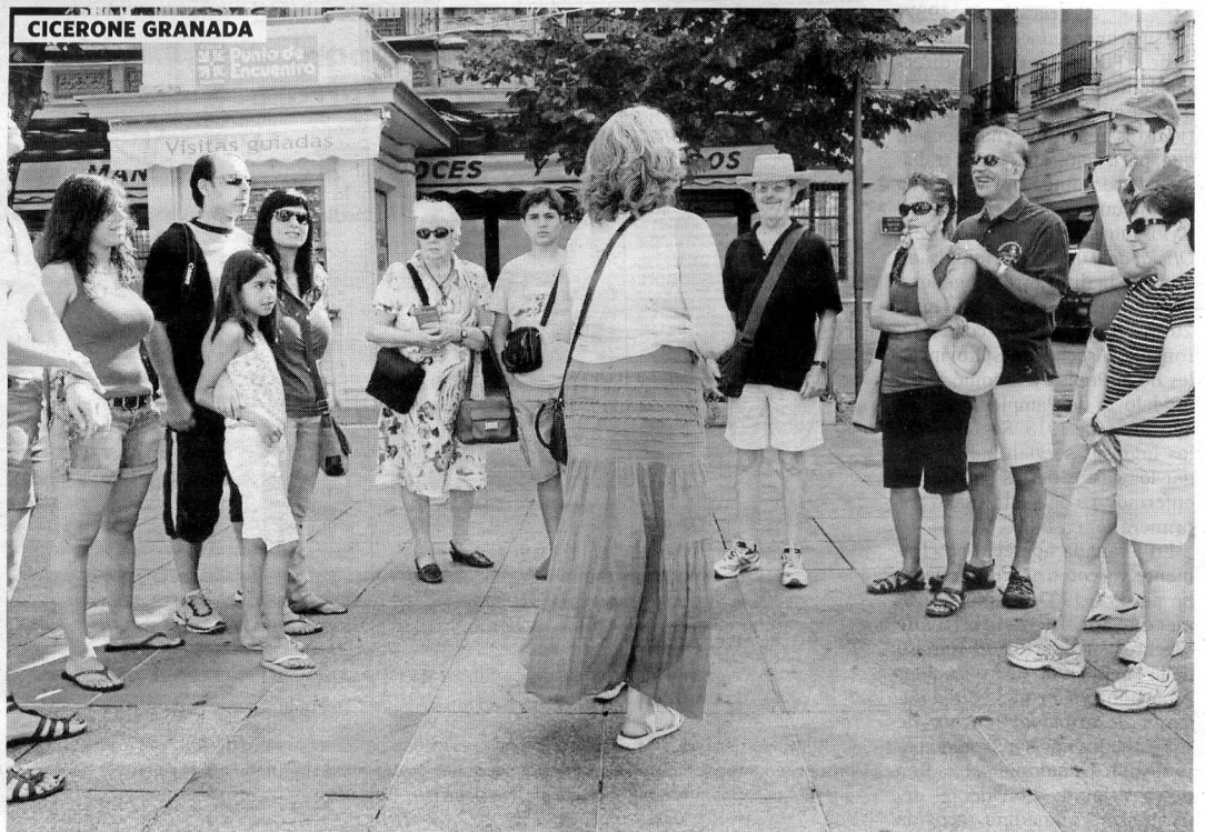
El punto de encuentro para las visitas está en la Plaza Bib-rambla.

De cara al verano, desde el próximo 15 de julio, amplían su oferta con visitas temáticas, que tienen entre sus objetivos atraer a los granadinos.