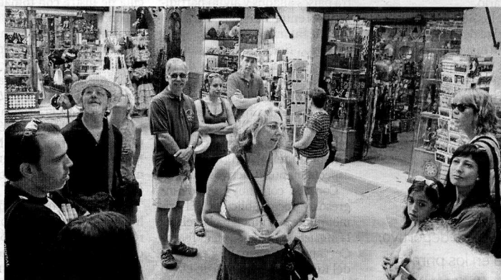
Las guías suelen tener grupos de entre diez y quince personas.