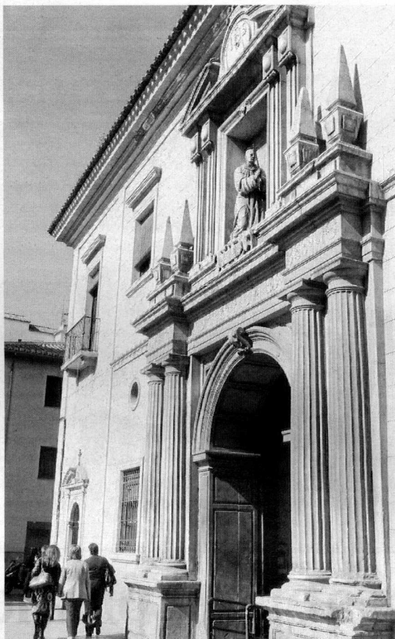
Fachada del edificio por San Juan de Dios.

El edificio ya ha sido objeto de varias obras de emergencia: la primera, para la recogida de aguas pluviales. También se tuvieron que consolidar las pinturas de los patios y la escalera monumental del primer patio se tuvo que cerrar al público por el peligro de desprendimiento de la balaustrada debido a su deterioro.