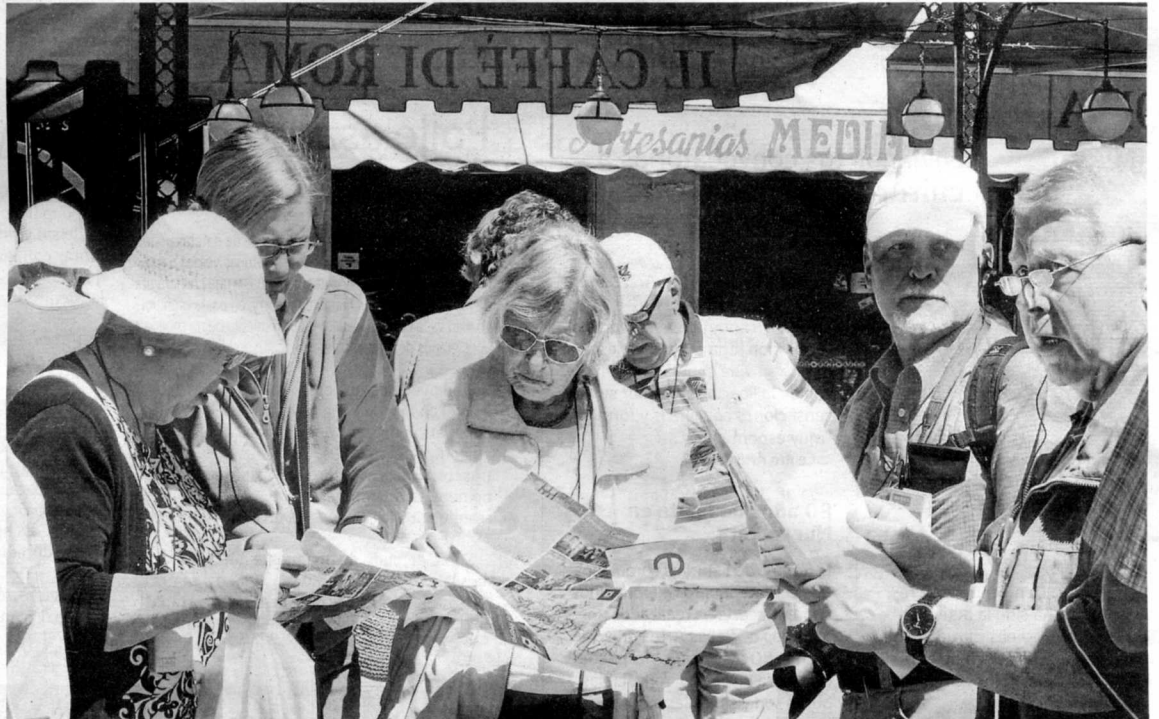
Los turistas se sienten atraídos por los lugares donde se muestra un interés por atenderlos.

Los que se animen en el curso podrán completar el aprendizaje con otra enseñanza en la red