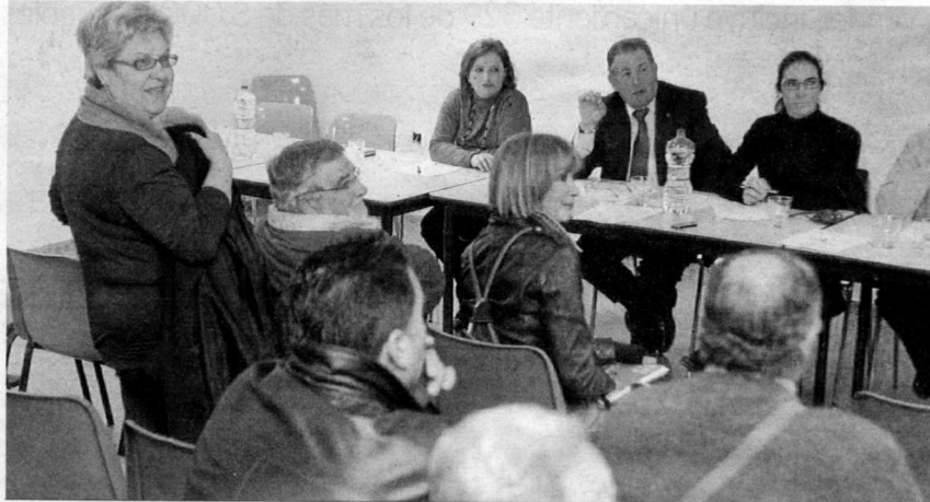
La Junta Municipal se celebró en el centro cívico del Zaidín.

Las asociaciones y vecinos que han optado por marcharse han convocado para la próxima semana una asamblea ciudadana en la que expondrán su postura ante éste y otros asuntos del barrio. Hay que recordar que los vecinos decidieron marcharse de la Junta ante la "inoperancia, prepotencia y faltas al reglamento