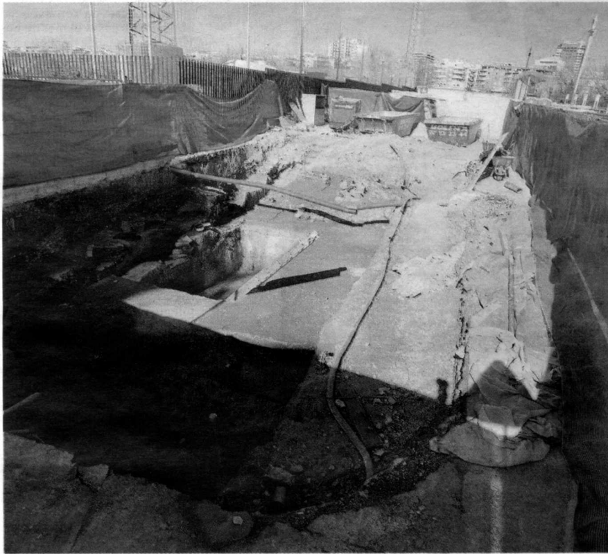
Prospecciones en las obras que se realizan en el campus universitario.

El diputado considera que para Granada, el progresivo cierre de medios de transporte es un «factor evidente de empobrecimiento», máxime si se tiene en cuenta que «la actividad turística, ligada al transporte de media y larga distancia, es uno de los pocos elementos de desarrollo con que cuenta la provincia».