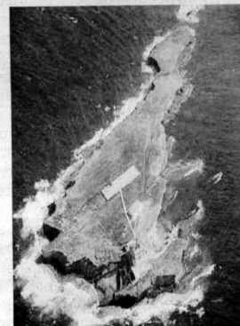
La isla de Alborán. :: IDEAL

La estación GPS está integrada en la red geodinámica del ROA, y «permite el cálculo de las velocidades relativas de convergencia entre las placas euroasiática y africana en el entorno del mar de Alborán, además de contribuir en redes GPS europeas y mundiales», explicó Antonio Pazos.