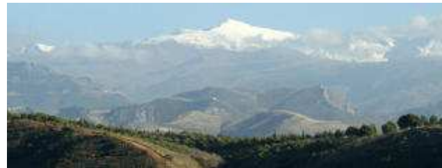
El pico Veleta, en una imagen de archivo. Ruiz de Almodóvar

EFE El cambio climático ha propiciado en la última década la pérdida del 15% del hielo fósil del Corral del Veleta (3.100 metros), en Sierra Nevada, que está vinculado a un antiguo circo glaciar surgido en la Pequeña Edad del Hielo, entre los siglos XIII y XIX.