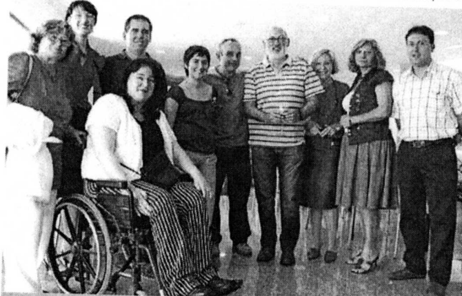
En la imagen, los miembros del equipo del Centro de Atención al Estudiante (CAE) de la UA.

a los alumnos en cuestiones académicas. De esta meta nacen los talleres de técnicas de estudio, los cursos para afrontar los exámenes o los de técnicas de relajación para superar la ansiedad. Pero junto a esta encomienda se añaden otras dos misiones: la vocacional y la personal.