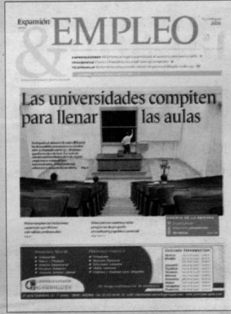
Junio 2006. La caída de la natalidad ha reducido el número de alumnos en las universidades, que se ven obligadas a competir y a cambiar muchas inercias.