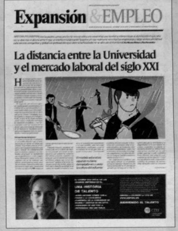
Junio 2009. Las voces que piden una mayor conexión entre la Universidad y la empresa se han intensificado con la crisis, pero queda mucho camino por recorrer.