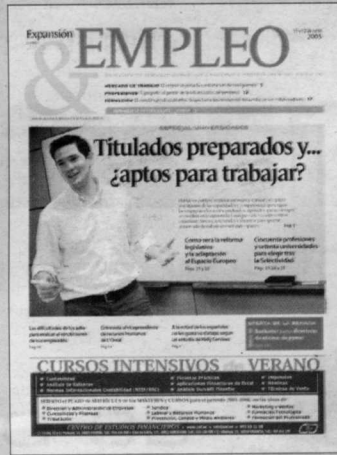
Junio 2005. El debate sobre si las universidades españolas preparan a los titulados de forma adecuada para su éxito en el mercado laboral no ha cesado.