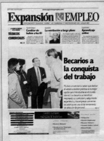
Junio 2001. Se ha regulado la figura del becario y las prácticas en las empresas, que acogen cada año a miles de universitarios en busca de su primera experiencia.