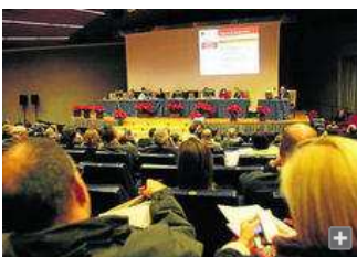
Los representantes de la comunidad universitaria granadina, ayer.