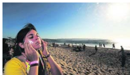
El uso de cremas fotoprotectoras es la mejor forma de prevenir la aparición de manchas y de mantener a raya las que ya existen.

Los cuidados deben mantenerse durante el invierno para evitar que las lesiones reaparezcan o se agraven