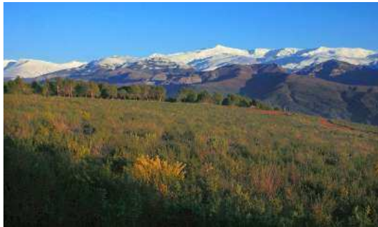
Vista panorámica de Sierra Nevada.

Granada.- El Parque Natural y Nacional de Sierra Nevada (Granada) cuenta con 123 especies de vegetación amenazadas, de las que ocho de ellas están en peligro de extinción, lo que constituye el 7% del total de la flora de este espacio natural.