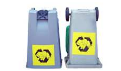
Imagen: Antonio Jiménez Alonso

Las obras de arte deben estar constituidas, al menos, con un 60% de materiales de desecho