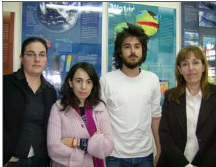
Científicos del Departamento de Física Aplicada de la UGR implicados en el proyecto

Siguiendo esas metodologías se han realizado a nivel internacional varias proyecciones climáticas para toda la tierra. El Panel Intergubernamental de expertos para el Cambio Climático (IPCC) es el organismo científico que desarrolla este tipo de predicciones a nivel global. Sin embargo, a la hora de considerar dichas proyecciones para regiones concretas, como es Andalucía, la unidad de detalle es demasiado amplia y no muestra las diferencias del cambio esperado entre zonas próximas. La unidad de detalle es la distancia de superficie terrestre mínima que considera la proyección climática generada, se trata de una cuadrícula de territorio cuya longitud de lado es su resolución. Las estimaciones propuestas desde el IPCC tienen una resolución de cientos de kilómetros, de forma que para buena parte de España prevén una misma dinámica climática.