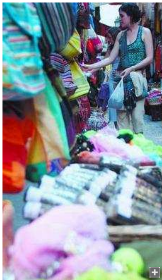
El número de viajeros y pernoctaciones cayó en 2007.

No hay que olvidar el rebrote de la inflación sufrido por los consumidores granadinos. El Índice de Precios al Consumo pasó del 2,9 fijado en 2007 a los 4 puntos de diciembre de 2007, lo que genera un mayor endeudamiento de las familias granadinas.