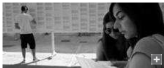
Varios alumnos consultan las notas de Selectividad en el Hospital Real.

La diferencia por sexos no ha sido muy significativa. Igual que años atrás, las mujeres, con un 6,89, han superado ligeramente a los hombres, que han sacado de nota media un 6,81. Aunque la presencia de ellas, unas 2.389, en estas pruebas fue muy superior al de ellos, 1.748. En los datos que proporciona la UGR se incluyen también los del campus de