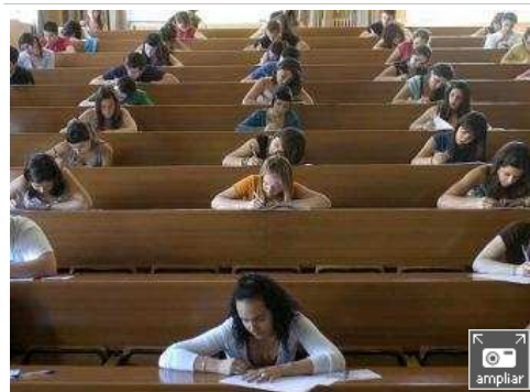
Prueba de Selectividad

"De los nervios no me salían las palabras", confesaba ayer una estudiante tras la primera prueba de Selectividad. Más de 28.000 jóvenes comenzaban los exámenes en Andalucía con un comentario de texto. Los repasos de última hora, las apuestas por ver "lo que cae" y los nervios ante la inminencia de las pruebas dominaron este día en el que dicen "jugárselo todo". Muchos jóvenes coincidían en la preocupación por las notas de corte en las universidades y en la confusión sobre qué carrera elegir. Las licenciaturas que exigieron más nota el año pasado fueron Biotecnología, con un 8,81 en la Universidad de Sevilla, y Medicina, con un 8,74 en la Universidad de Granada . Los exámenes finalizarán el próximo jueves, después de tres días "frenéticos". Los resultados, el 26 de junio.