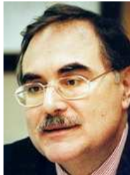
Candidato. Al rectorado de la UGR.