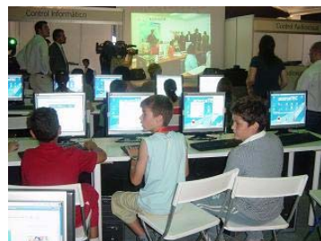
Imagen de archivo