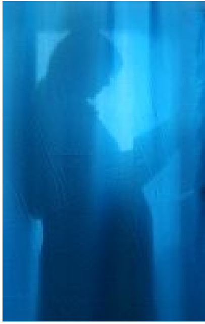
Una mujer embarazada lee un libro tras una cortina.

Durante el embarazo los tóxicos pueden trasladarse al bebé, que tendrá