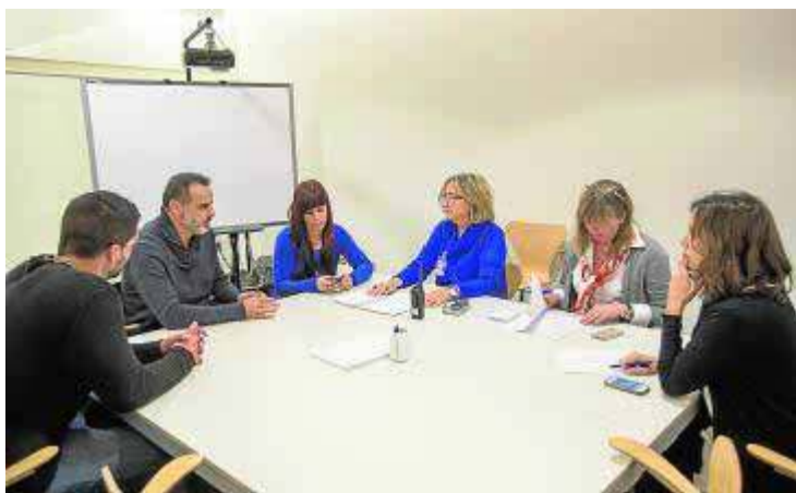
Reunión preparatoria del congreso.