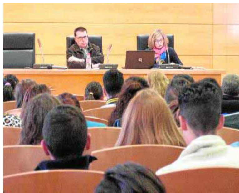
Apertura de las jornadas.

La línea de mecenazgo de la UGR sigue abierta. Se siguen recogiendo firmas en change.org . Aún se necesita mucho dinero para llevar a cabo los ensayos clínicos.