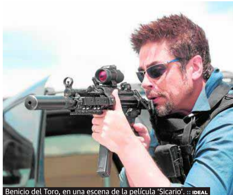
Benicio del Toro, en una escena de la película 'Sicario'.