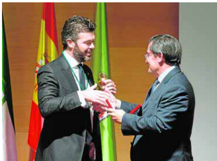
Pablo Heras-Casado recibe su galardón de hijo predilecto.

En nombre de todos los premiados, el director de orquesta Pablo Heras-Casado agradeció los galardones de la Diputación Provincial y aseguró en su intervención que todos los que habían tenido el honor de compartir estos premios «representan la Granada abierta en la que he crecido. La Granada que se ha hecho en democracia, la que queremos fortalecer y de la que me siento orgulloso cuando estoy fuera de esta tierra, como estoy seguro de que lo están muchos jóvenes que trabajan fuera». Asegu-