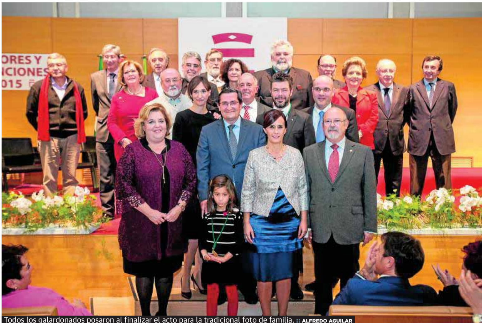
Todos los galardonados posaron al finalizar el acto para la tradicional foto de familia.