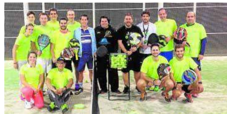
Participantes del curso de profesor en La Inmaculada. :: IDEAL

Los alumnos observaron el pádel de manera multidisciplinar, con preparación física específica, psicología aplicada, análisis y evaluación del rendimiento a través del video, organización y arbitraje de campeonatos, estrategia y táctica, planificación y programación de las clases, organización y gestión de centros deportivos, marketing, metodología y progresión de los golpes básicos, especiales y de definición y ejercicios de alta competición.