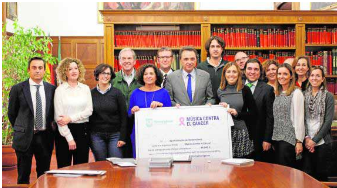
La rectora recibe el cheque de los promotores del evento junto a parte de los investigadores.