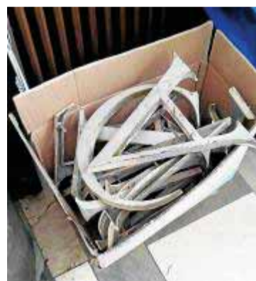
Las letras, en una caja. :: IDEAL

Pero, ¿qué pasará ahora con la antigua Facultad de Medicina?