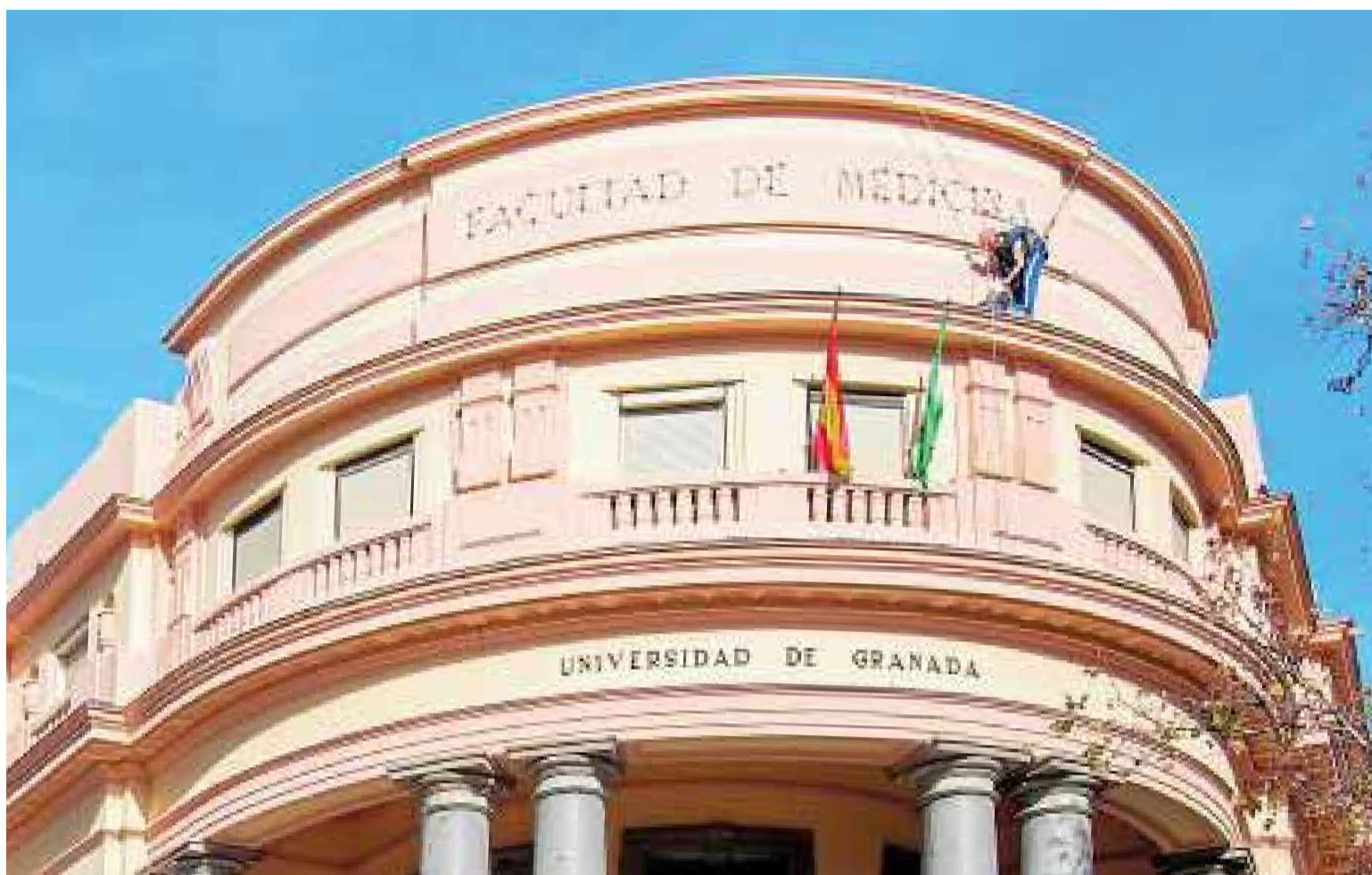
Los operarios se encargaron durante toda la mañana de retirar las letras de la fachada de la antigua Facultad de Medicina.