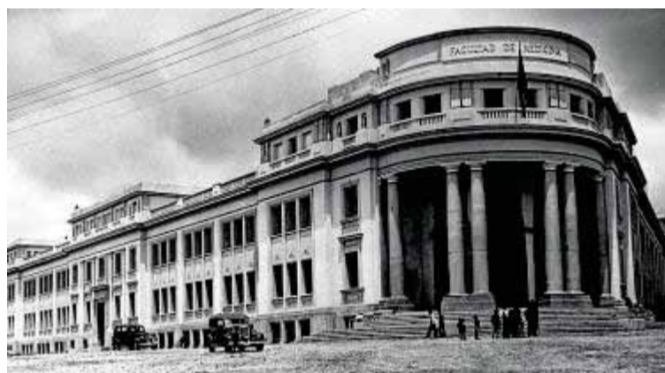
La histórica facultad se inauguró en junio de 1944.

«¡Podrán quitarle el nombre pero para mí, aunque pongan un chino, seguirá siendo la facultad!», afirmaba ayer en las redes sociales una de las personas que se hizo eco de que el edificio se estaba quedando sin nombre. En este mismo foro, surgieron los primeros interrogantes sobre cuál será el nuevo destino del inmuebles pero sobre todo hubo melancolía, mucha melancolía. «¡Qué pena de mi facultad! Tantas vivencias por esas aulas. Mis recuerdos siempre estarán en ese edificio», comentaba otra ciudadana tras conocer que se estaban desmontando las letras.