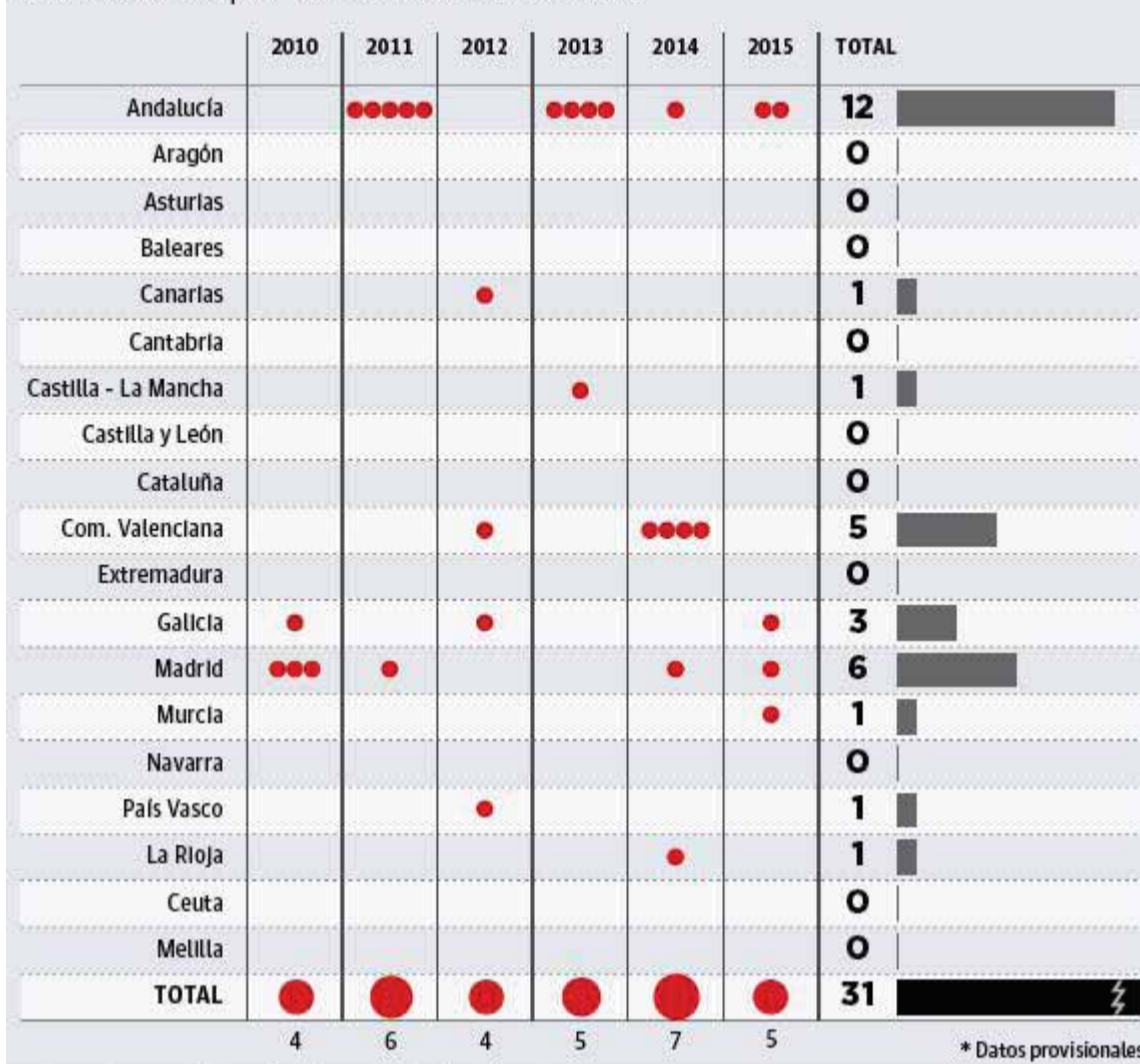
Defunciones por tos ferina. 2010-2015*

Fuente: Centro Nacional de Epidemiológica. Instituto de Salud Carlos III.