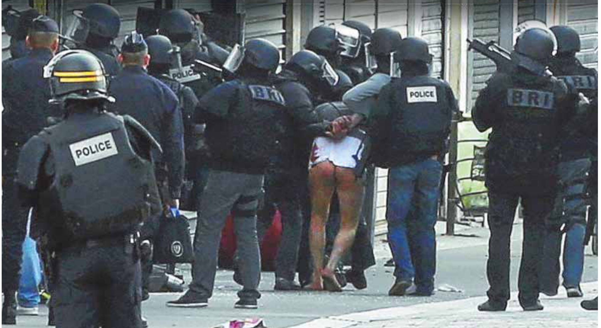
Uno de los detenidos en la operación policial contra un refugio de yihadistas en el barrio parisino de Saint Denis.

tamento, la Fiscalía cree que el comando desarticulado preparaba ataques en La Défense y en el aeropuerto Charles de Gaulle. P32A44