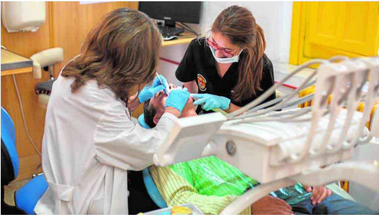
Universitarias tratan a uno de los pacientes de la Facultad de Odontología en el campus de Cartuja.