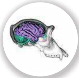
Chimpancés. Reconstrucciones realizadas por Aida G.-R. y J. M. de la Cuétara.

bles, que ha liderado una investigación que, por primera vez, cuantifica la heredabilidad de la organización cerebral de los chimpancés en comparación con los humanos y propor-