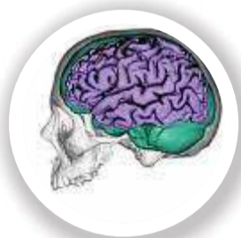
Humano. Reconstrucción tridimensional de un cráneo humano.