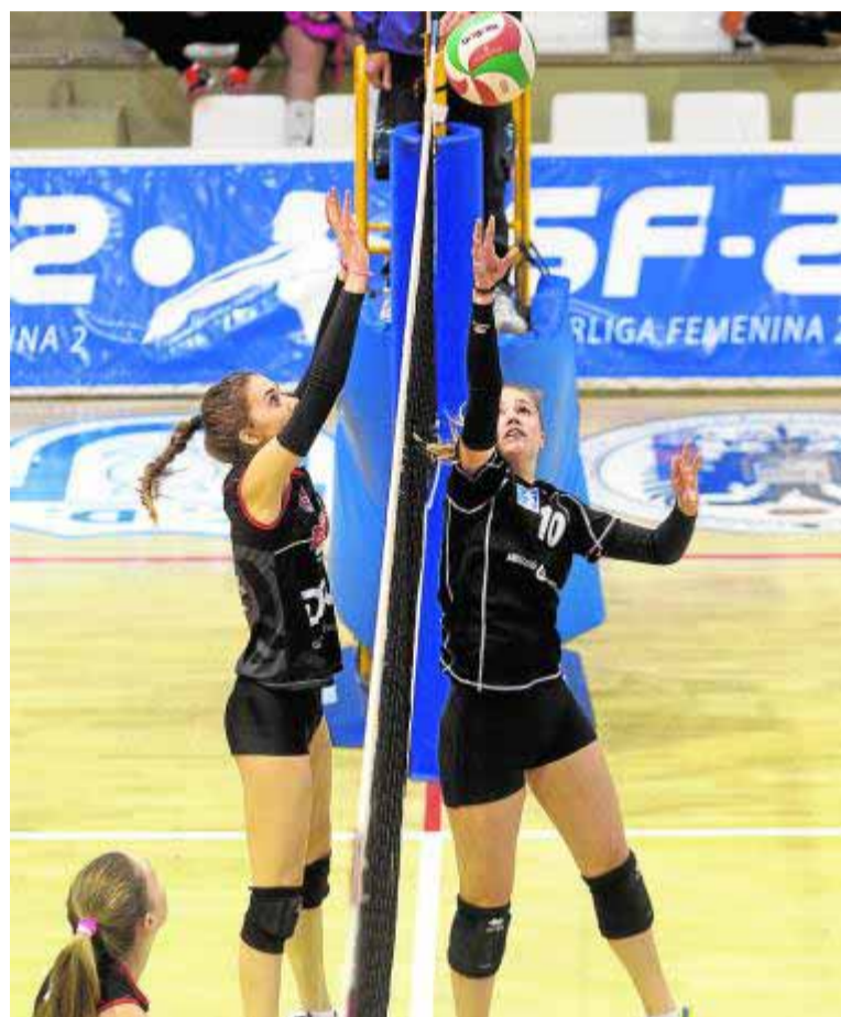
El Universidad de Granada se esmera ante Sant Cugat.

GRANADA. Arranca el fin el nuevo año para el equipo femenino del CD Universidad de Granada. La Superliga-2 vuelve a la acción tras una larga pausa navideña de un mes y para las jugadoras de Fran Santos ese regreso se producirá en Guadalajara. El Motorsan aguarda mañana (13 horas) la llegada del equipo univer-