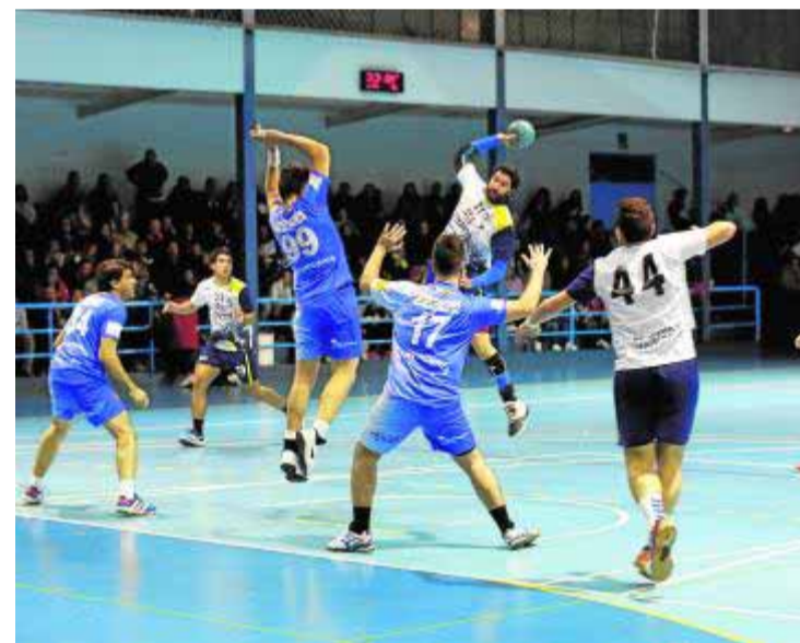
Lanzamiento del Maracena el día del Manzanares.