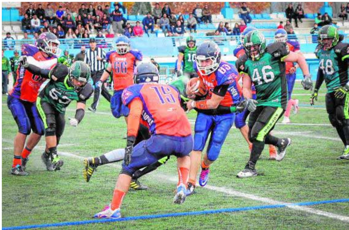
Los Lions se emplean a fondo frente a Fuengirola Potros.

Osos Rivas, Black Demons Las Rozas y Camioneros de Coslada, los principales perjudicados por esta sorprendente medida, han emitido un comunicado conjunto en el que denuncian que el verdadero motivo de esta pelea reside «en el contencioso del reconocimiento de licencias y estatus territorial de la ACFAM», un asunto que desde hace tiempo está en manos del CSD. Los tres conjuntos de Madrid señalan que «tenemos un júnior en una competición que se ha inscrito en tiempo y forma en FEFA. Si no la quiere reconocer, la FEFA sabrá cuál es su intención y el daño que genera tan-