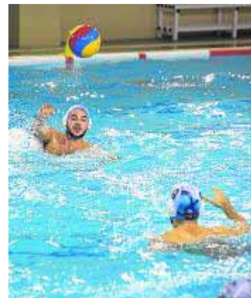
Partido de Inacua Balcón.

El Chiclana, rival de esta tarde, ostenta la tercera posición en la tabla de Primera Andaluza tras haber perdido solo ante Jerez y Emasesa. Sin embargo, la imagen trans-