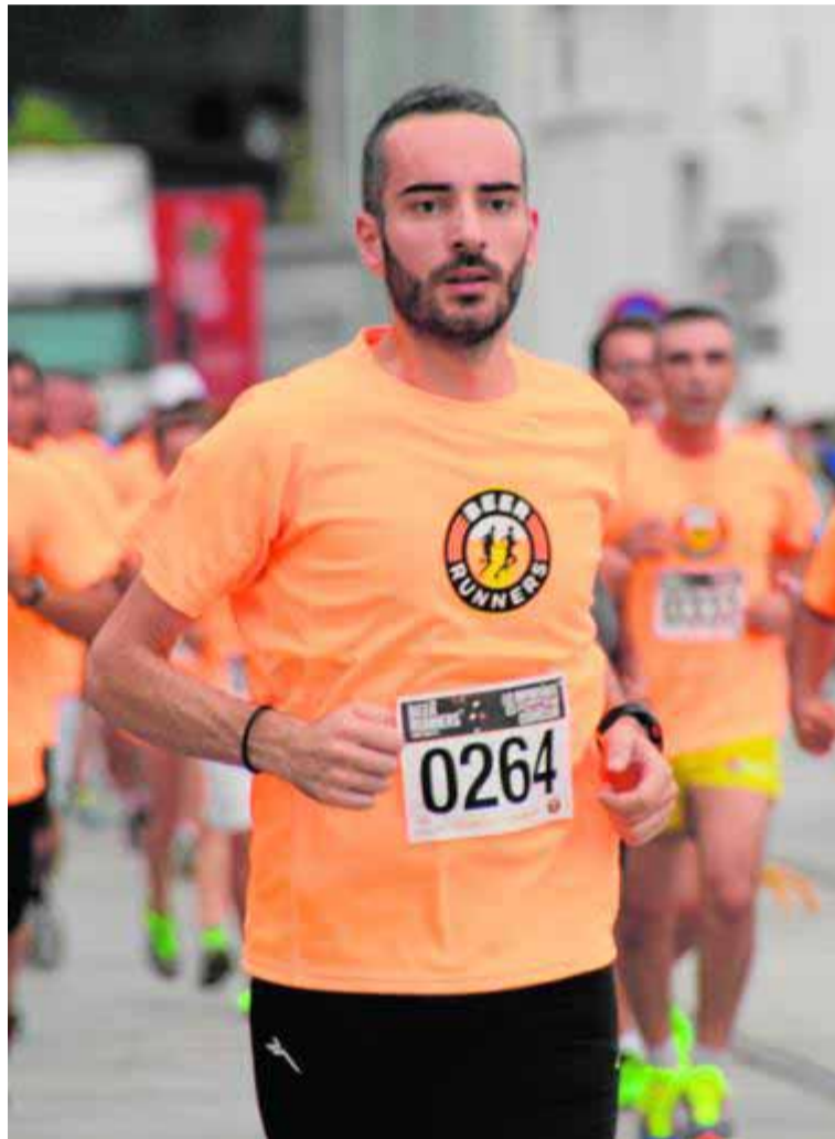
Carrera en Vigo, el pasado 19 de julio.

«Llevo toda la vida aconsejando a la gente hacer deporte, haciendo investigaciones que demuestran las virtudes del ejercicio, y nadie me había hecho ni caso. Pero hablo de cerveza y miles de personas se ponen a correr y en Estados Unidos brindan por mí. Soy como su santo patrón», bromea Castillo, a quien el Ayuntamiento de Filadelfia le concedió una nominación por su «investigación innovadora» y su esfuerzo en «tender puentes culturales» entre ambas ciudades. El médico, preocupado por matizar que él no aconseja a nadie beber alcohol, está orgulloso de haber puesto los cimientos de un movimiento que combina salud y sociabilidad.