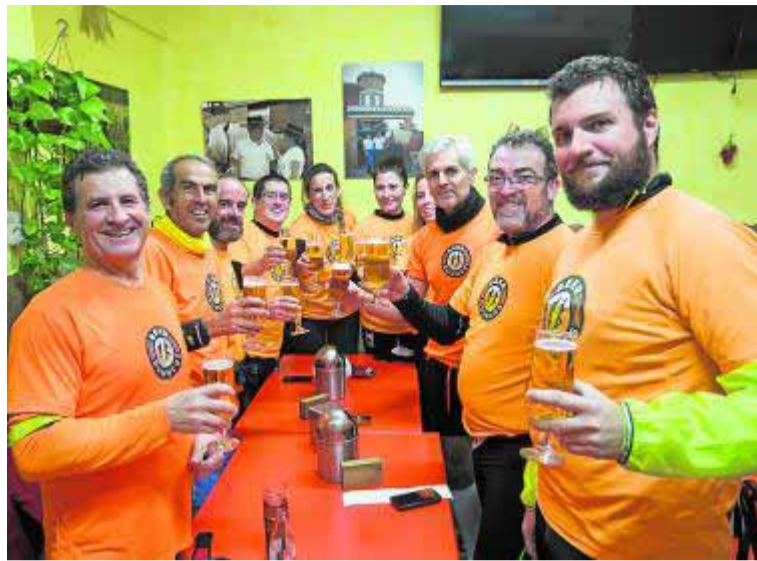
Los Beer Runners de Granada brindan, la semana pasada.

camisetas naranjas con el logo de Beer Runners en el pecho y la leyenda 'Mucho más que correr' en la espalda han regalado Cerveceros de España, que también ha repartido 32.000 cervezas en las carreras.